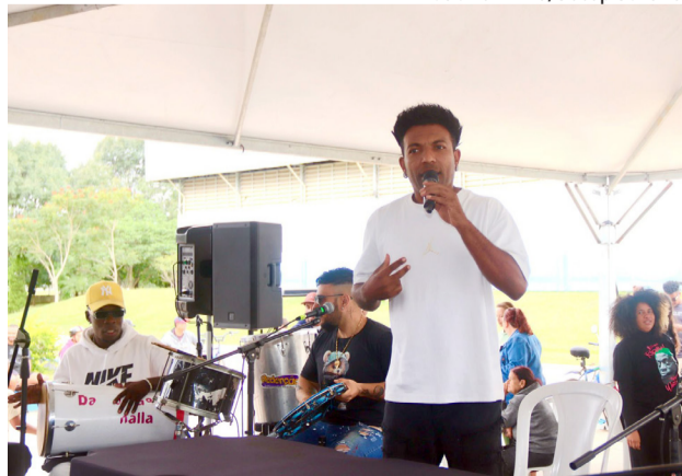
Iniciativa contribui para fortalecer o cenário cultural