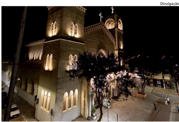
A devoção a Sant'Ana acompanha a história de Mogi

Durante 17 dias, milhares de fiéis, moradores e visitantes são esperados para participar da programação religiosa e social preparada pela Catedral. A festa contará com missas, novena, procissão, momentos de oração e a tradicional quermesse, que reúne gastronomia típica,