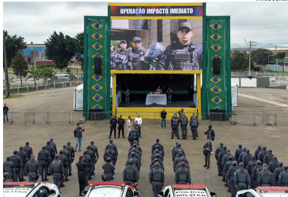
Ações de combate à criminalidade reuniram forças policiais e órgãos municipais

O balanço da operação apontou prisões por tráfico de entorpecentes e a apreensão de centenas de porções de drogas, além de dois aparelhos celulares com suspeita de utilização em atividades criminosas. Entre as ocorrências registradas, uma equipe da GCM efetuou a prisão de um indivíduo por tráfico de drogas na Vila Áurea. No Jardim Estela, equipes da Força Tática da PM prenderam outros dois suspeitos. Já na Vila Perracine, policiais da ROCAM realizaram mais duas