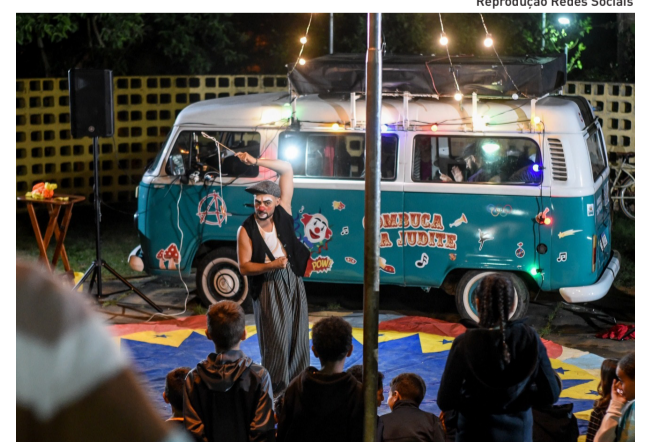
Reprodução Redes Sociais

A programação do Parque Centenário integra a agenda da 17ª edição do Festival de Inverno de Mogi das Cruzes, que seguirá até o final de julho com dezenas de atrações culturais gratuitas distribuídas por diversos espaços da cidade, valorizando a produção artística local e proporcionando experiências culturais para públicos de todas as idades.