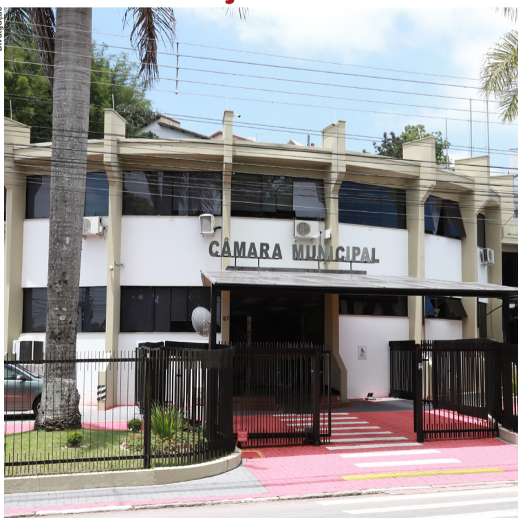
Interessados em participar do concurso da Câmara de Arujá têm até a próxima semana. Cidades, página 5