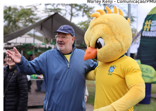
O prefeito comemorou a forte presença do público

No último encontro, realizado no domingo (5), durante