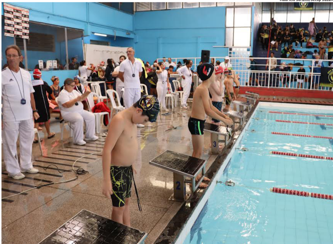
Mauricio Sordilli/Secop Suzano

A Copa Junina Poá 2026 tem novo encontro marcado com a torcida. Neste domingo (5), o Brasil enfrenta a Noruega pelas oitavas de final da Copa do Mundo, às 17 horas, com transmissão gratuita na Praça de Eventos Lucília Gomes Felipe. Cidades, página 4