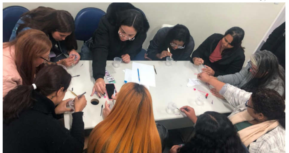
Nesta nova etapa, os cursos passaram a ser oferecidos nos três períodos

Nesta nova etapa, os cursos passaram a ser oferecidos