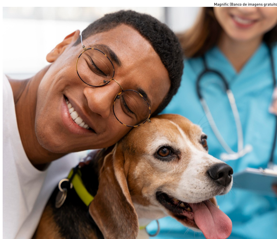
Médica veterinária alerta sobre cuidados especiais para pets durante o inverno

Roupas e cobertores: Cães de pelagem curta, filhotes, idosos e felinos sem pelo se beneficiam muito de