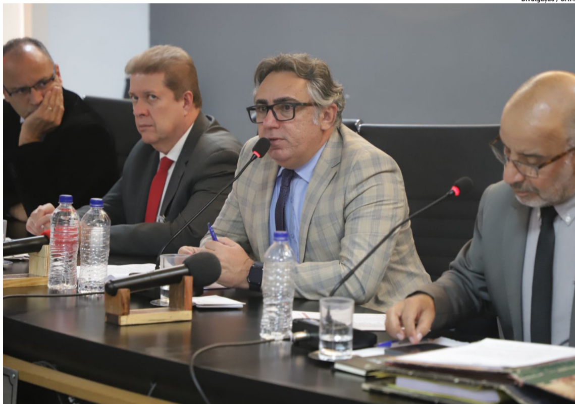
Recurso do Governo Estadual será destinado para pavimentação e drenagem pluvial no bairro

Governo de SP confirma dois novos casos de sarampo. p3