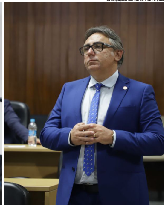
Presidentes das Câmaras de Suzano e Mogi destacam semestre produtivo e projetam desafios