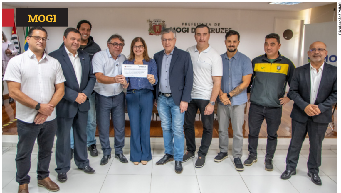
Centro Esportivo de Braz Cubas terá obras de reforma. Cidades, página 5