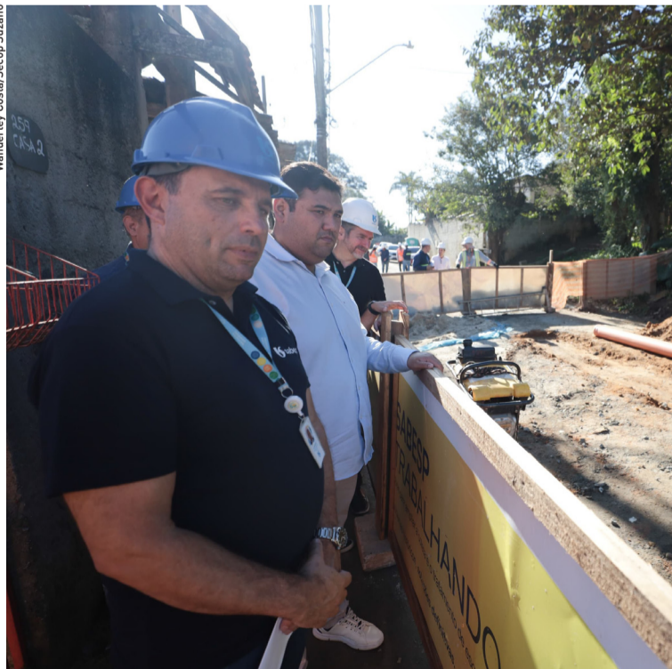
Prefeitura de Suzano e Sabesp avançam com obras para universalização do saneamento. Cidades, página 4