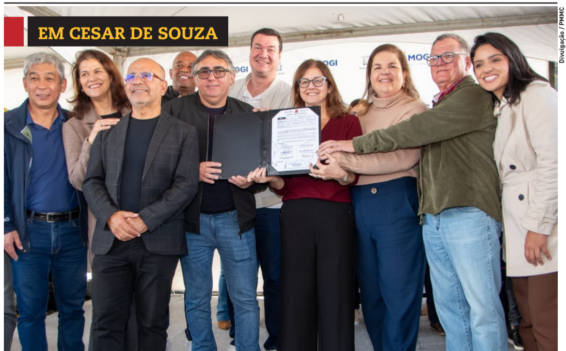
EM CESAR DE SOUZA

O Projeto GUARD (Grupo Unido na Ação de Resistência às Drogas) da GCM de Arujá deu início ao seu ciclo de formaturas do primeiro semestre. Cidades, página 4