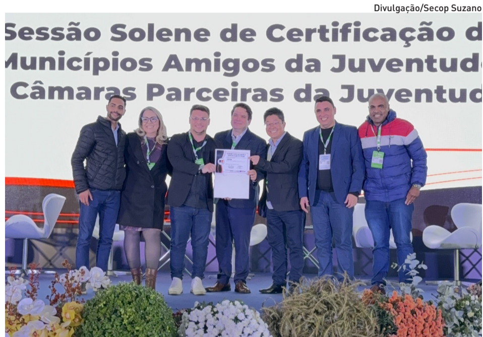
Reconhecimento foi entregue durante a 9ª edição do evento 'Conexidades'