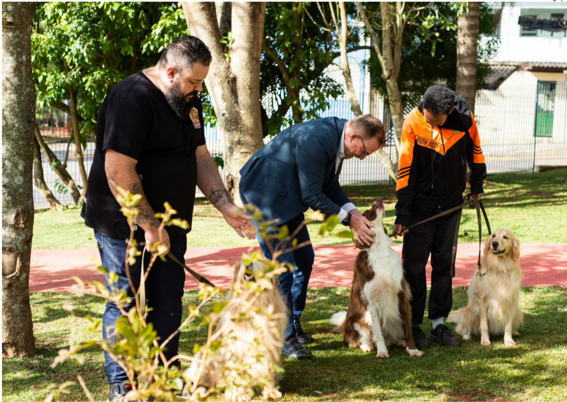
A entrega desses espaços reflete uma política pública ativa em prol da causa animal na cidade

Entregue na última quarta-feira (17), o ParCão do Bosque do Real se junta ao equipamento similar entregue, no Parque dos Ipês, na semana anterior. A Prefeitura de Arujá segue empenhada, reforçando o compromisso com a qualidade de vida dos animais e seus tutores. Cidades, página 3