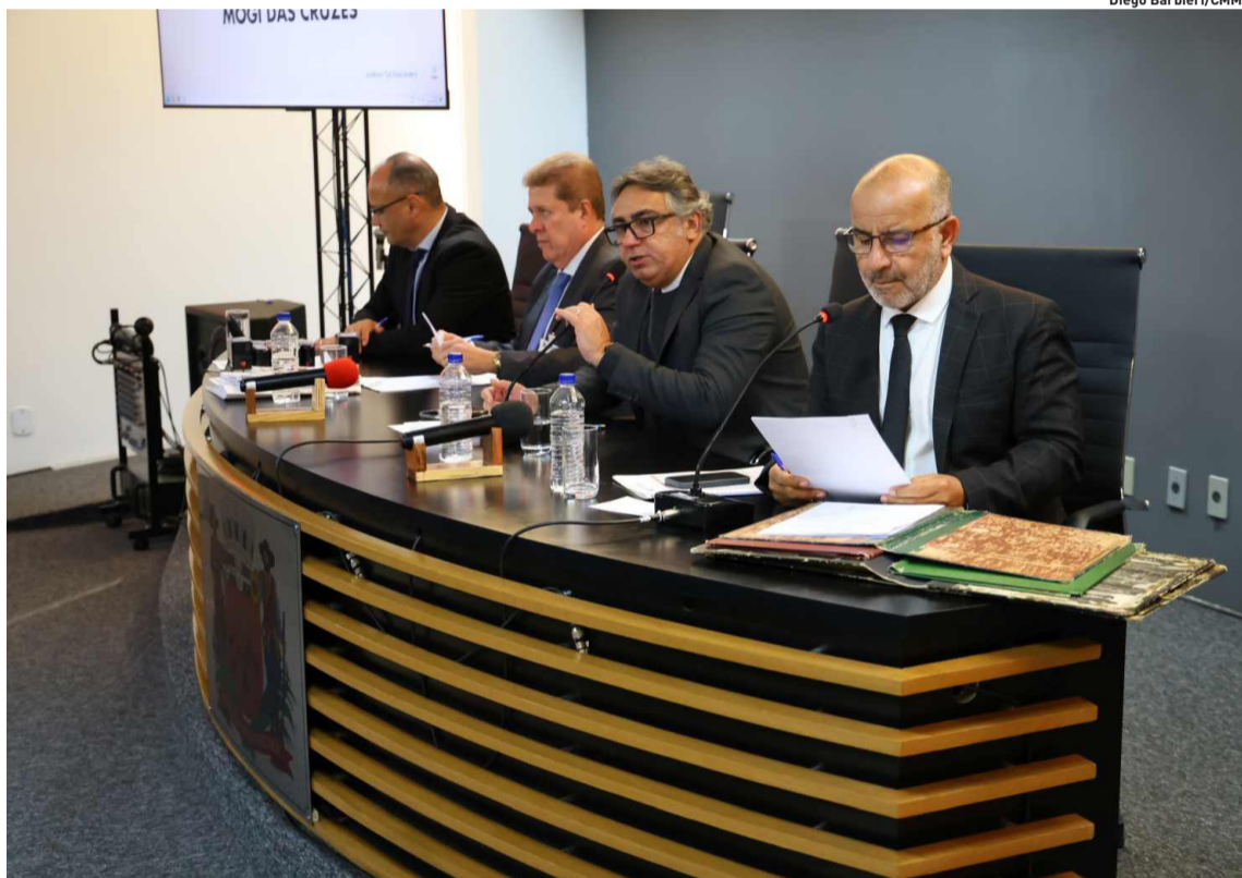
Câmara também solicitou reparos e cancelamento de multas na Estrada das Varinhas

Condemat+ realiza Fórum Regional de Mulheres. p5