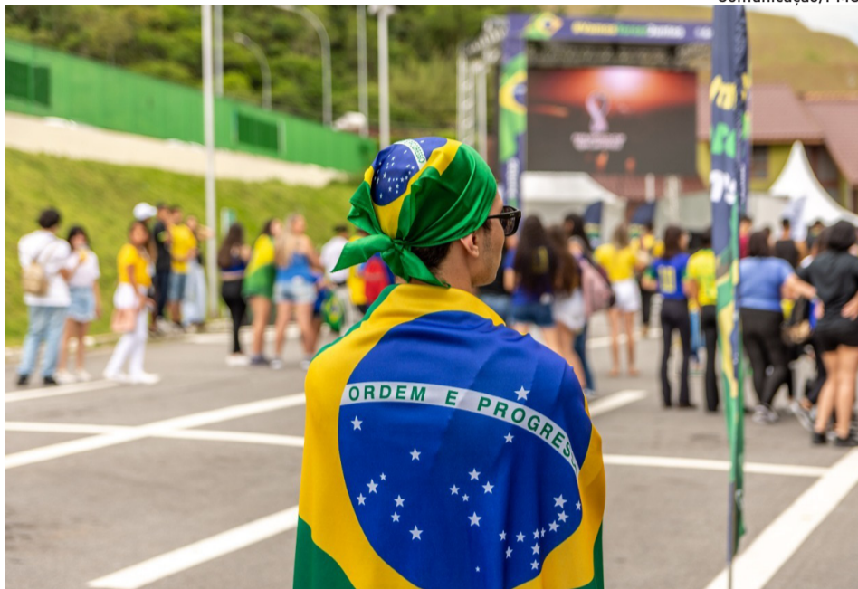
A população de Guararema participará votando nos estabelecimentos favoritos

Além de orientar o público, o roteiro incentiva e valoriza a criatividade dos empreendedores que prepararam vitrines, fachadas e ambientes decorados para