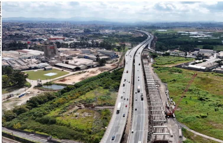
Wanderley Costa/Socop Suzano

Obras foram vistoriadas pelo prefeito, vice-prefeito e secretário na última quarta-feira (03). Cidades, página 3