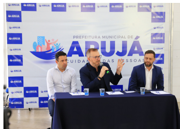
Plano de trabalho do hospital foi apresentado em abril

Ainda na área escolar, nesta semana Camargo participou da cerimônia de lançamento da pedra fundamental, que marca o começo da construção da primeira escola estadual em tempo integral da cidade, no bairro Jardim Emília. A nova unidade será construída