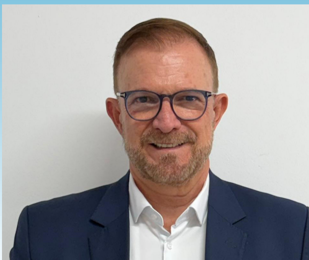
Prefeito Luis Camargo aponta conquistas importantes