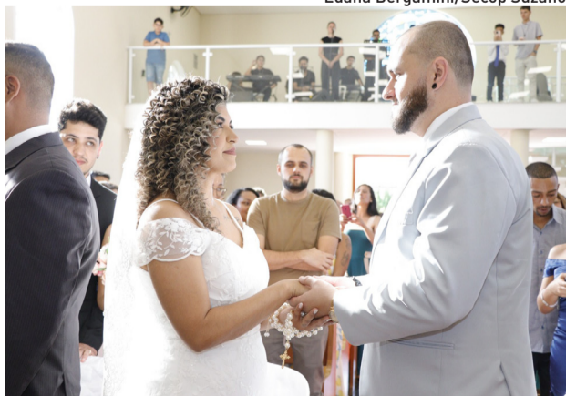
Luana Bergamini/Secop Suzano

Os interessados devem comparecer ao Paço Municipal