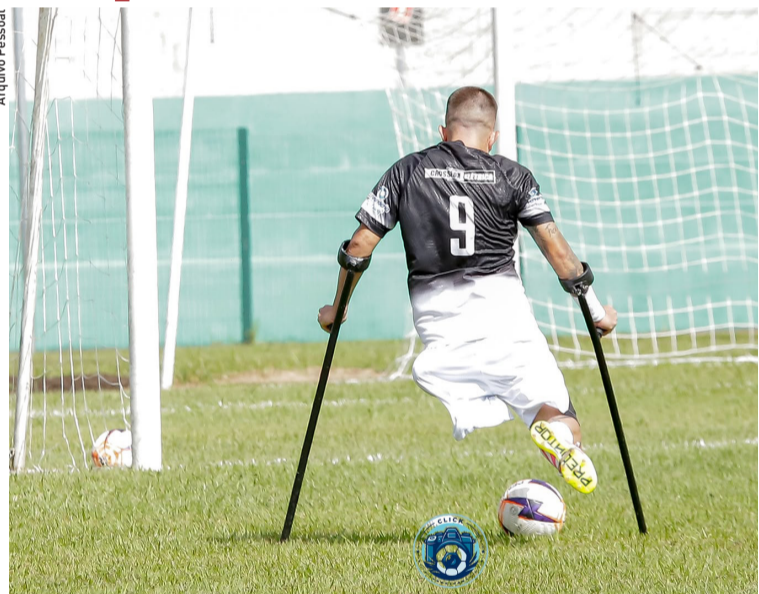
Equipes do Corinthians Mogi, Portuguesa e Instituto Rogerinho R9 representarão a cidade. Cidades, página 8