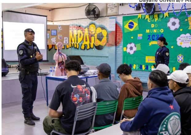
Projeto promove palestras e rodas de conversas

As ações fazem parte da atuação preventiva e comunitária da corporação, que busca aproximar as forças de segurança da população.