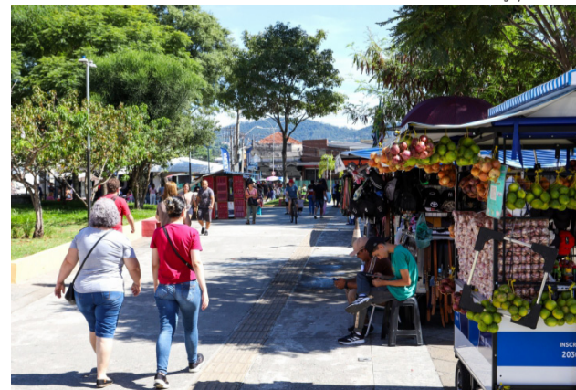
O programa reúne ações de diversas secretarias

O programa reúne ações de diversas secretarias, com foco nas áreas de segurança, cultura, atividades físicas, zeladoria, empreendedorismo, mobilidade urbana e saúde.