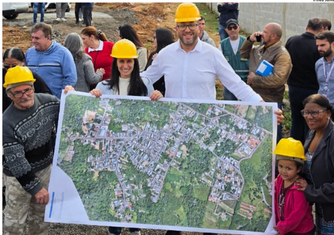
Visita da secretária Natália Resende marcou avanço da implantação do sistema de coleta no bairro

O prefeito de Poá, Saulo Souza, recebeu nesta sexta-feira (29) a secretária de Meio Ambiente, Infraestrutura e Logística do Estado de São Paulo, Natália Resende, para uma visita técnica às obras de implantação da rede de esgoto na Vila São Francisco. Cidades, página 3