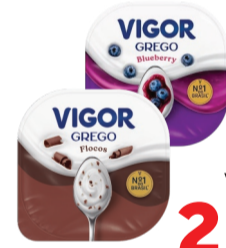
Iogurte Grego Vigor 90g