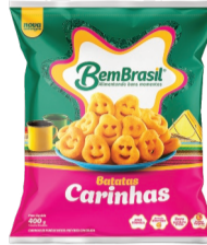
Batata Carinhas Bem Brasil 400g