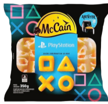
Batata McCain PlayStation 350g