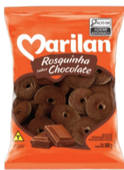
Biscoito Marilan Rosquinha 300g