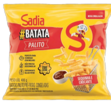
Batata Palito Sadia 400g