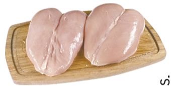
Peito de Frango s/ Osso s/ Pele Resfriado kg