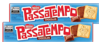
Biscoito Passatempo Recheio Chocolate 130g (Exceto Leite)