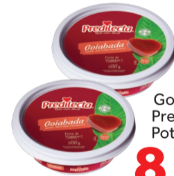
Goiabada Fruitecota Pote 500g