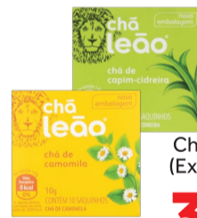
Chá Leão 10g (Exceto Boldo)