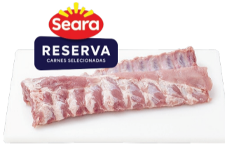
Costela Suína Seara Reserva kg