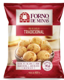
Pão de Queijo Forno de Minas 820g (Exceto Receita Caseira)