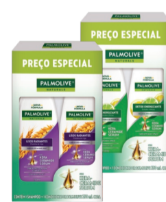
Kit Palmolive Naturals Shampoo + Condicionador 350ml (Exceto Kids)