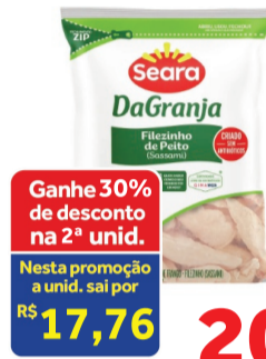
Filezinho de Peito de Frango Congelado DaGranja Pacote 1kg

Ganhe 30% de desconto na 2ª unid. Nesta promoção a unid. sai por R$ 17,76