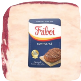
Contra Filé Bovino Porcionado Friboi kg