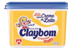
Margarina Claybom 500g