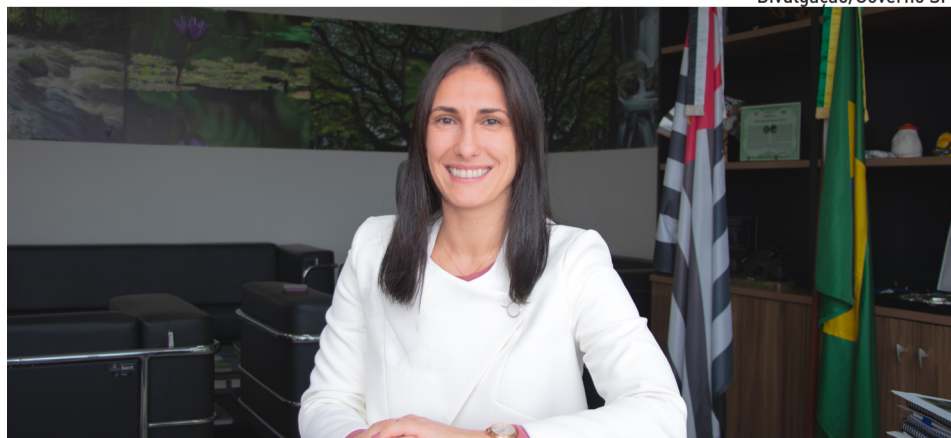
Secretária de Meio Ambiente, Infraestrutura e Logística estará na Vila São Francisco