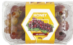
Uva Vermelha s/ Semente Honey Bandeja 500g