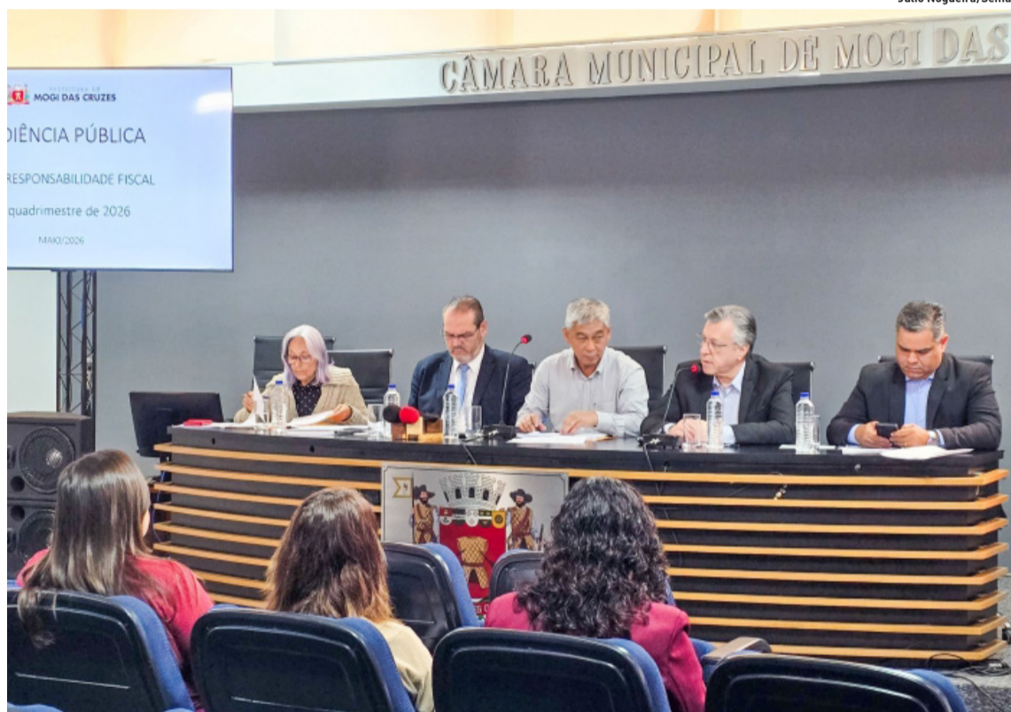
Secretário de Finanças afirmou que a arrecadação equivale a 35,81% do total orçado para o ano

REGIÃO Auxílio-aluguel atende mais de 200 mulheres. p3