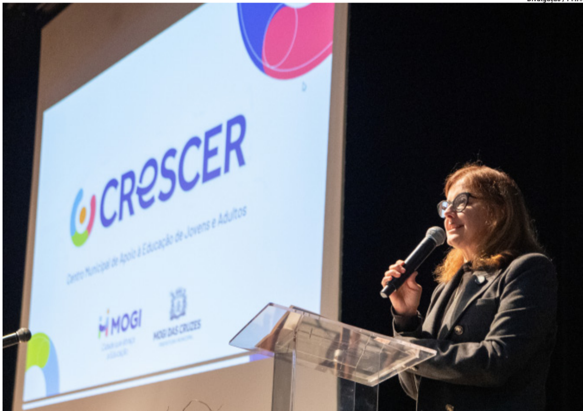
O lançamento do novo CRESCER na terça-feira contou com palestra e apresentação musical

A Prefeitura de Guararema está construindo um “pocket parking” na região central da cidade. O equipamento integra o complexo viário que conecta os bairros Nogueira e Centro e está sendo implantado na esquina entre as ruas Dezenove de Setembro (em frente à Estação Literária “Prof. Maria de Lourdes Évora Camargo”) e Maria Aparecida Freire Martins, com proposta voltada à ampliação da Mobilidade Urbana e à qualificação da circulação de veículos, pedestres e ciclistas. O novo equipamento integra o conjunto de melhorias realizadas no complexo viário inaugurado em 2024.