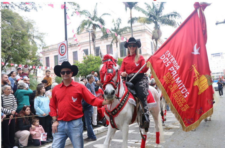
Cortejo tradicional recebe inscrições de cavaleiros, muladeiros, charreteiros e carroceiros. Cidades, página 8