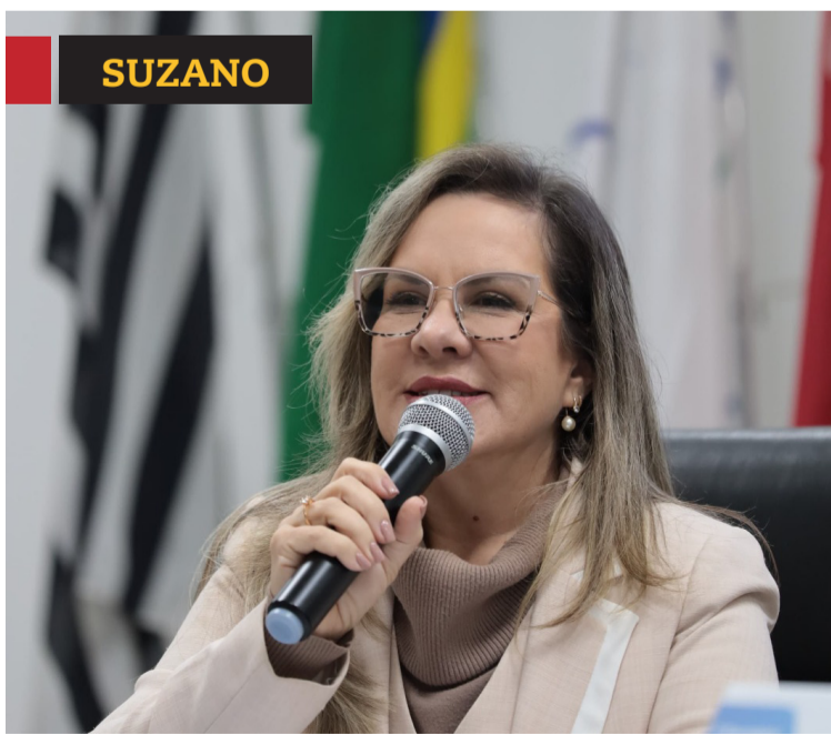
» Administração destaca 939 convocações e 504 contratações desde 2025. Cidades, página 4