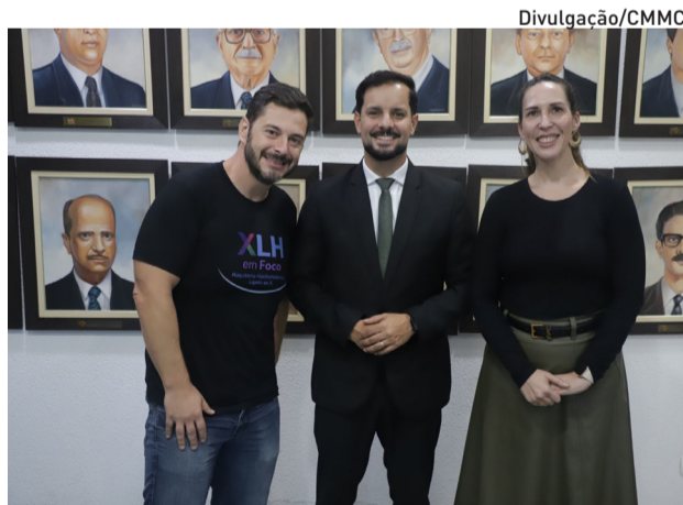
Moção solicita a ampliação do acesso ao tratamento

A Moção solicita às instâncias competentes o reconhecimento da XLH como condição rara com impacto significativo na saúde pública, a ampliação do acesso ao medicamento Burosumabe (Crysvita) e a implementação de programas