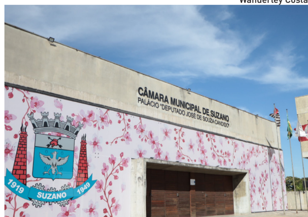
O público poderá acompanhar a sessão no plenário

O público poderá acompanhar a sessão ordinária da Câmara de Suzano no Plenário (rua dos Três Poderes, 65, Jardim Paulista) ou pela internet, pelo canal TV Câmara Suzano no YouTube e pela página da Casa de Leis no Facebook.