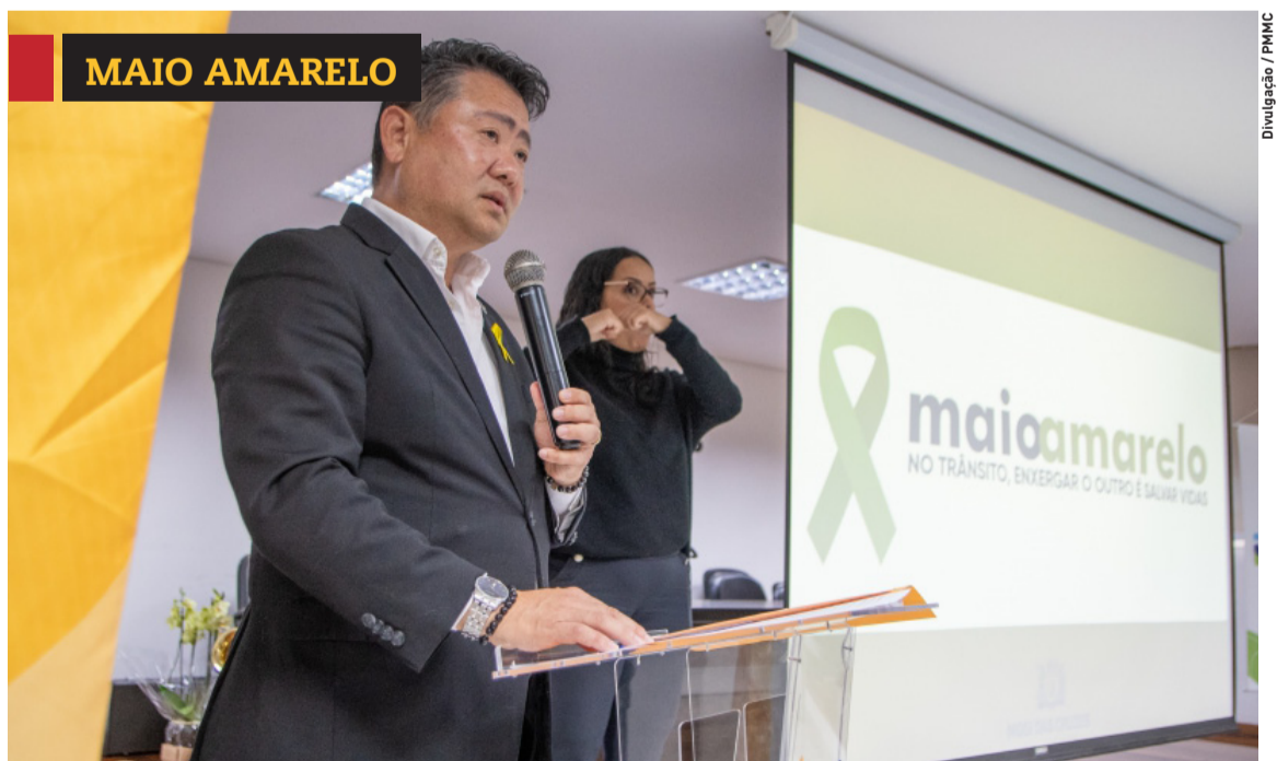
» Simpósio em Mogi destaca comportamento seguro. Cidades, página 4