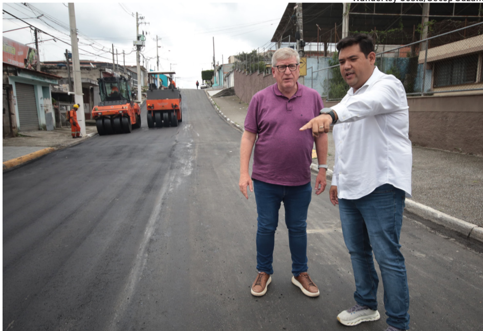
Os serviços que estão chegando nos bairros já têm promovido impacto na cidade

Para favorecer o eixo centro-Casa Branca, foi aberto, por meio de R$ 17,8 milhões de investimento, o prolongamento da avenida Senador