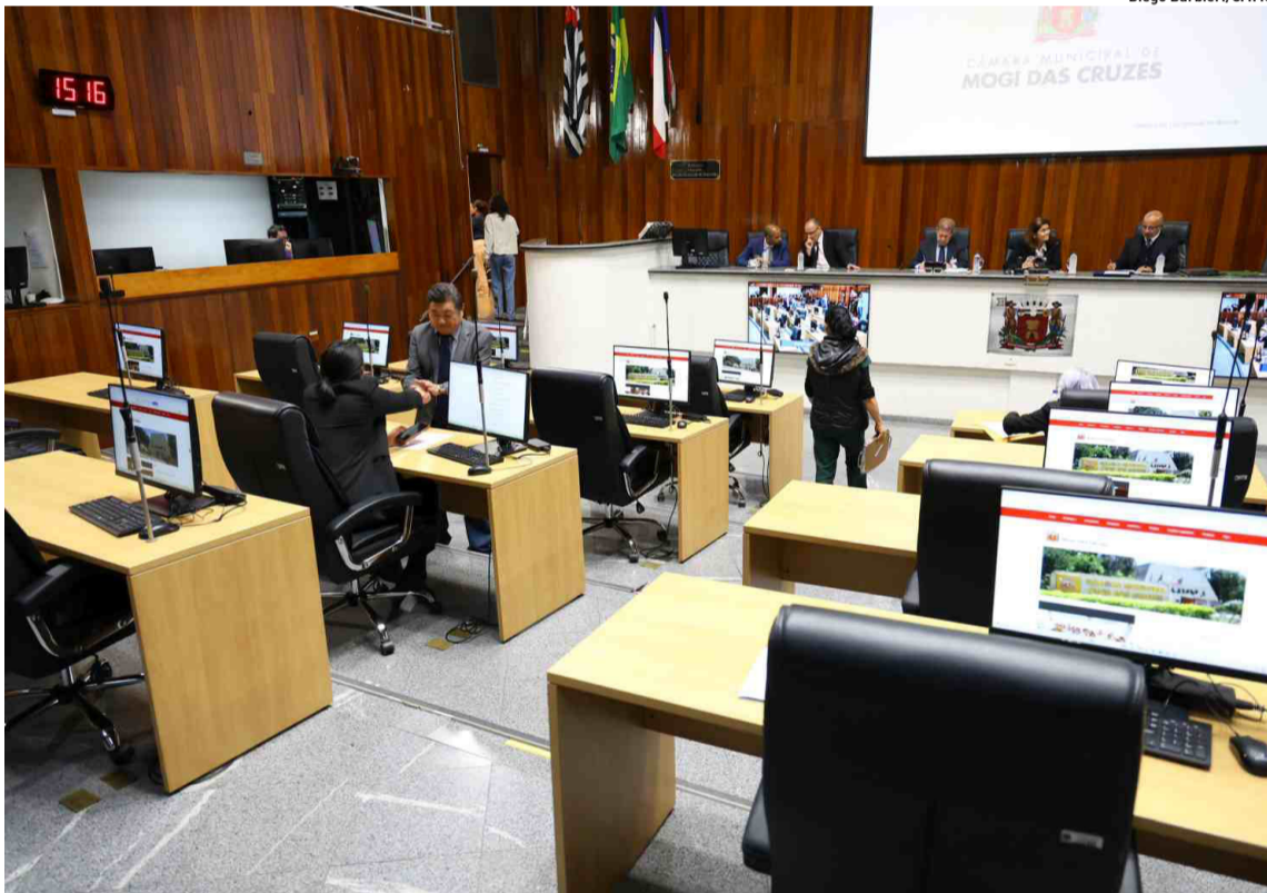
Os vereadores de Mogi aprovaram também o projeto que institui o mês “Setembro Caramelo”

AJUDA DIRETA Quermesse do Divino conta com 28 entidades. p8