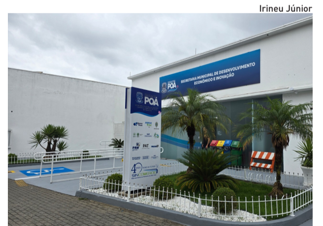
O encontro será realizado na sede da Secretaria

O encontro será realizado das 9 às 13 horas, na sede da Secretaria de Desenvolvimento Econômico, localizada na Rua Vinte e Seis de Março, 372, no Centro de Poá. A participação é gratuita e as inscrições podem ser feitas pelo link: https://inscricao.sebraesp.com.br/produto/