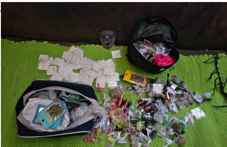
A Guarda Civil Municipal (GCM) realizou operação com a apreensão de 1.135 entorpecentes. Cidades, página 4