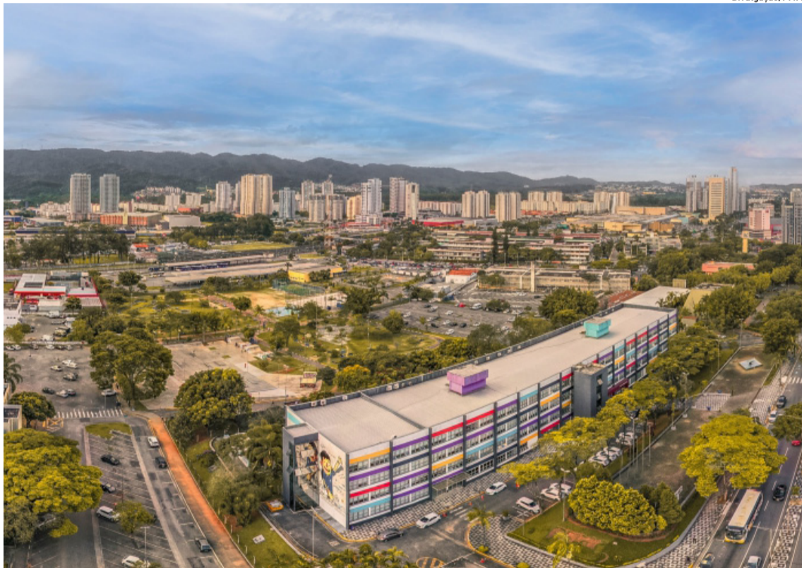
No recente levantamento, Mogi contabilizou 7.534 admissões e saldo de 784 postos de trabalho

MOGI Novo CRESCER terá aula inaugural nesta terça. p8