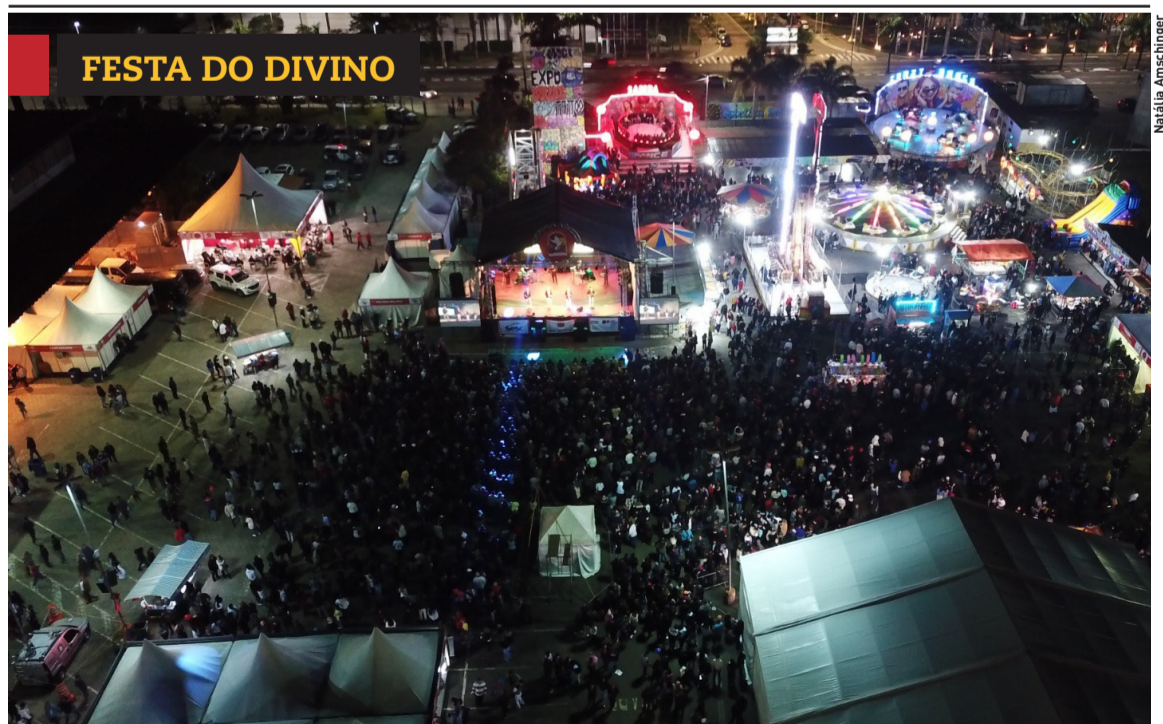
FESTA DO DIVINO

O Alto Tietê conquistou o Selo Diamante — Referência de Atendimento pelo Sebrae Aqui da Associação Comercial e Industrial de Ferraz - ACIFV. Cidades, página 3