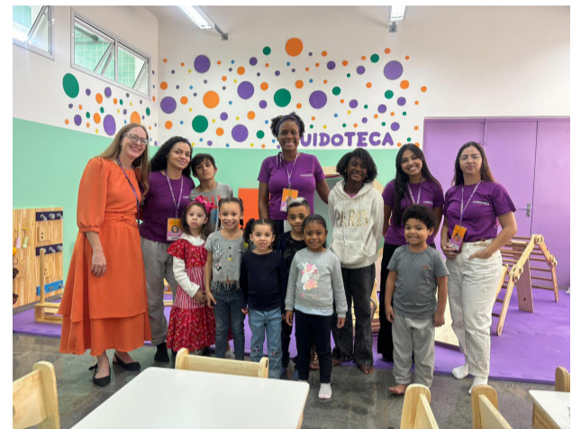
Cuidoteca vai acolher crianças de 3 a 12 anos

durante o período das aulas. O objetivo é oferecer suporte às mães, garantindo mais tranquilidade e condições para que possam se dedicar à qualificação profissional. “A inauguração da Cuidoteca e o