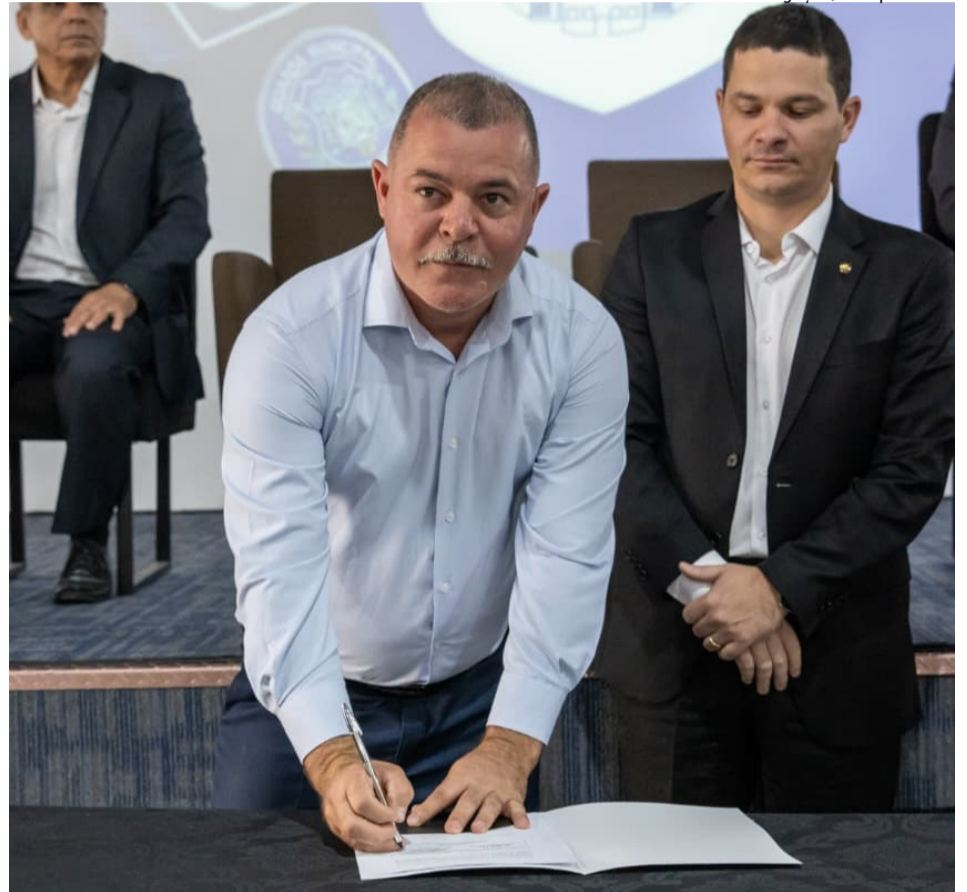
Secretário formalizou ingresso da cidade durante cerimônia realizada em Itaquá