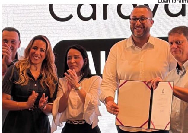
Prefeito e primeira-dama participaram da agenda regional

O governador ressaltou o diálogo com os municípios da região e o compromisso da gestão estadual com o desenvolvimento regional.