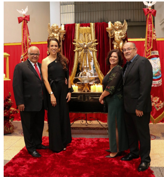
Organizadores preparam detalhes com dedicação

15 de maio a 23 de maio, a partir das 19 horas, na Catedral de Sant’Ana; as Alvoradas, de 16 de maio a 25 de maio, com saída às 5 horas, do Império, em frente à Catedral de Sant’Ana, no Centro da cidade; a Caminhada Ecológica; as duas Missas Campais, no espaço da Quermesse, nos sábados (16 e 23), às 15 horas; a Entrada dos Palmitos, no dia 23 de maio, às 9 horas; a Procissão de Pentecostes, dentre tantas outras atividades religiosas e culturais.