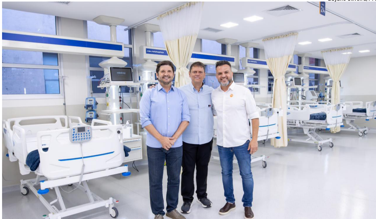
Governador Tarcísio de Freitas também entregou melhorias no Hospital Santa Marcelina de Itaquaquetuba

Durante a agenda na sexta-feira, o Governo do Estado também entregou melhorias no Hospital Santa Marcelina de Itaquaquetuba, com a