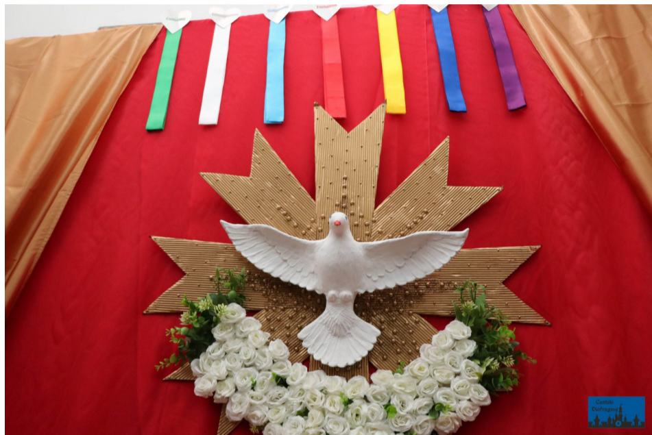
O tema deste ano é “Divino Espírito Santo, fazei de nós mensageiros da vossa Paz”

onde, tradicionalmente, um grupo de devotos já se reúne para conferir o layout das novas Bandeiras. Neste ato, a Congada Batalhão Nossa Senhora Aparecida se faz presente, louvando o Espírito Santo, em altar montado na residência. Logo em seguida, todos seguem em cortejo até a Prefeitura de Mogi das Cruzes. Às 16h30, autoridades municipais, dentre eles a prefeita de Mogi, Mara Bertaiolli, seu vice, Téo Cusatis, e o bispo recebem os participantes, e, na sequência, às 17h, um novo cortejo segue até a Praça Coronel Benedito de