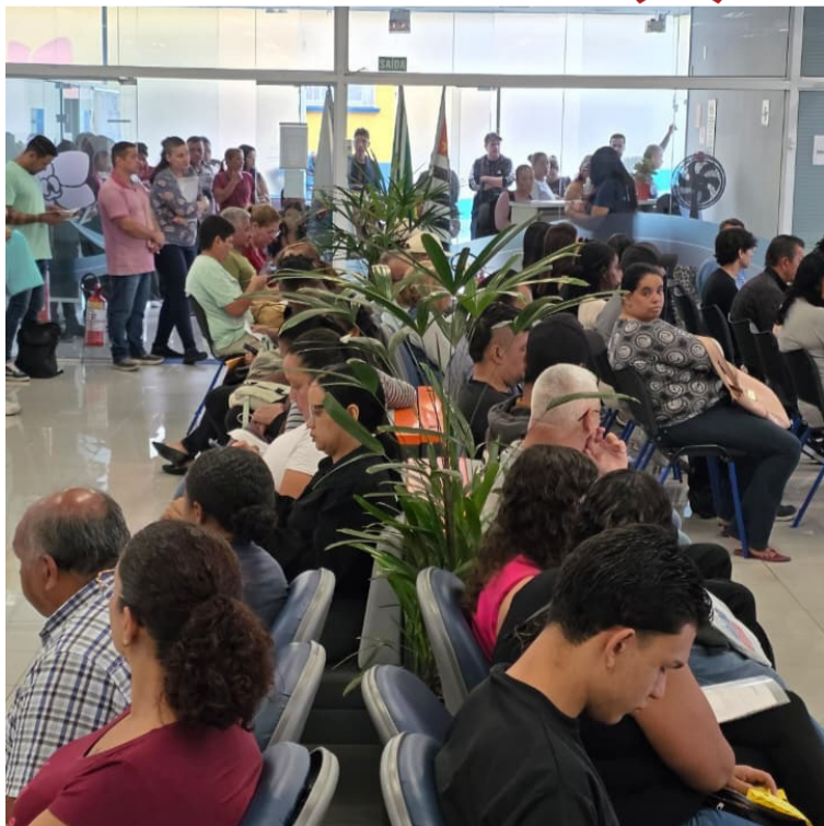
Ação terá oportunidades para diferentes perfis, incluindo vagas para Jovem Aprendiz. Cidades, página 4