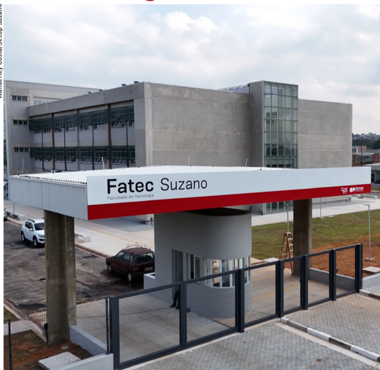
Governador Tarcísio de Freitas deve vir para entrega da Fatec e hemodiálise do hospital. Cidades, página 3

Fatec e hemodiálise do HRAT serão entregues nesta sexta