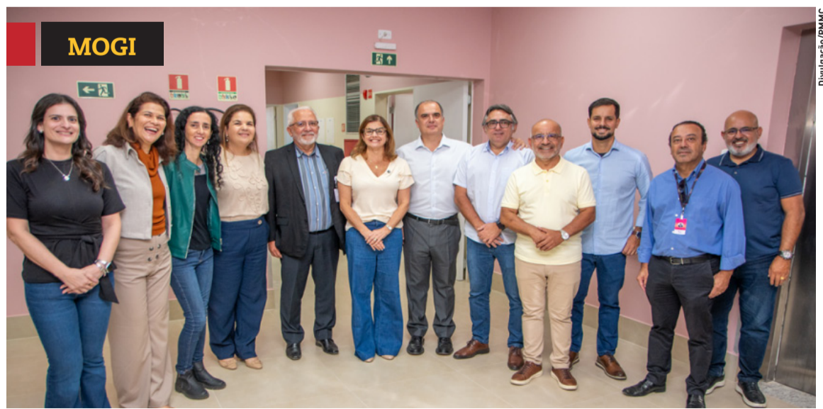
» Prefeitura inaugura no sábado complexo de saúde. Cidades, página 8

TURISMO Alto Tietê recebe curso de guia. p3