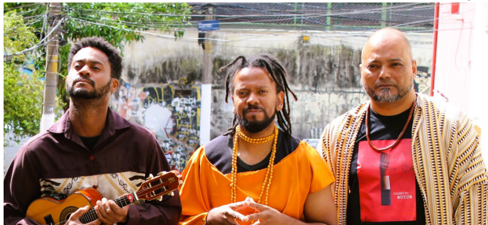
Espectáculo traz composições autorais e inéditas com diferentes vertentes