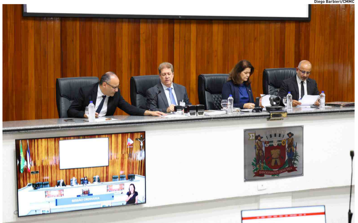
Os parlamentares também aprovaram na sessão de ontem moções de aplauso e congratulações

Na sessão desta quarta-feira (6), a Câmara de Mogi das Cruzes aprovou a Moção de Apelo nº 50/2026, solicitando ao governador do Estado de São Paulo, Tarcísio Gomes de Freitas, providências para ampliar e fortalecer a rede de prestadores de fisioterapia conveniados ao SUS Paulista. A iniciativa é de autoria do vereador Marcos Furlan (PP) e coautoria de outros parlamentares. O documento destaca que a remuneração atualmente paga aos profissionais de fisioterapia vinculados ao Sistema Único de Saúde está amplamente defasada. Também foram aprovados outros itens, como moções de aplauso e congratulações. Cidades, página 5