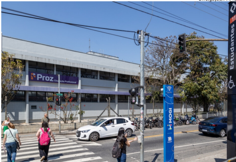
A queda de índices vem sendo intensificada desde o segundo semestre de 2025

A queda de índices criminais na cidade vem sendo intensificada desde o segundo semestre do ano passado, com a implantação do programa Smart Mogi pela Prefeitura. “Os investimentos do Smart Mogi têm um papel importante neste resultado, já que permitem o reconhecimento facial de procurados pela