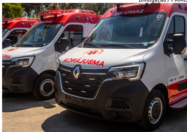
Unidade aumenta a cobertura do serviço na região

A estrutura tem equipe preparada e integrada à rede municipal de saúde. A base de Braz Cubas funciona das 7h às 19h, na avenida Henrique Peres, nº 11. Já a sede do Samu fica na rua Olegário Paiva, 37, Centro Cívico, e funciona 24 horas por dia.