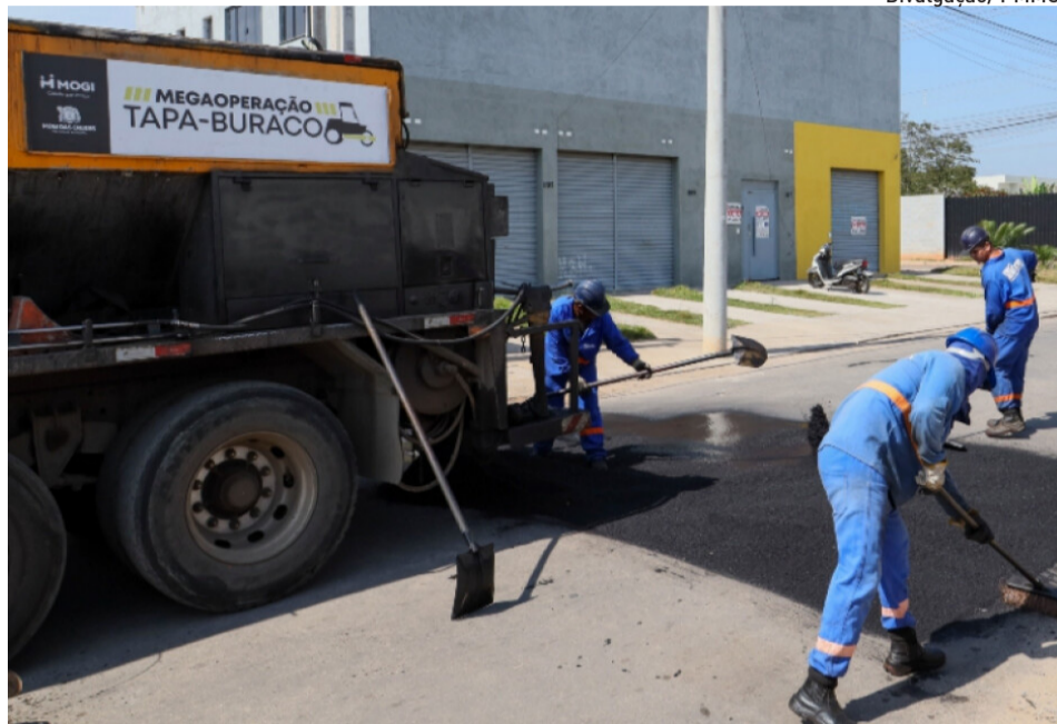
Megaoperação tem por objetivo tapar cerca de 3.100 buracos até o início de maio

As demandas também podem ser registradas no telefone fixo 4798-5027. E, durante