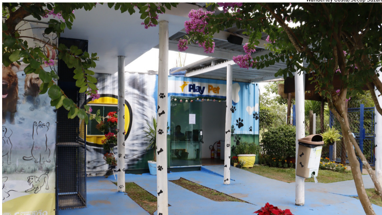
Wanderley Costa/Secop Suzano

Apenas em 2026, 86 novos usuários realizaram inscrições e 17 já renovaram suas credenciais. Em 2025, o número de carteirinhas confeccionadas ultrapassou 200, e mais de 2 mil foram emitidas desde a inauguração do espaço, em 2019. O número de frequentadores do espaço cresce mensalmente, enfatizando a adesão dos