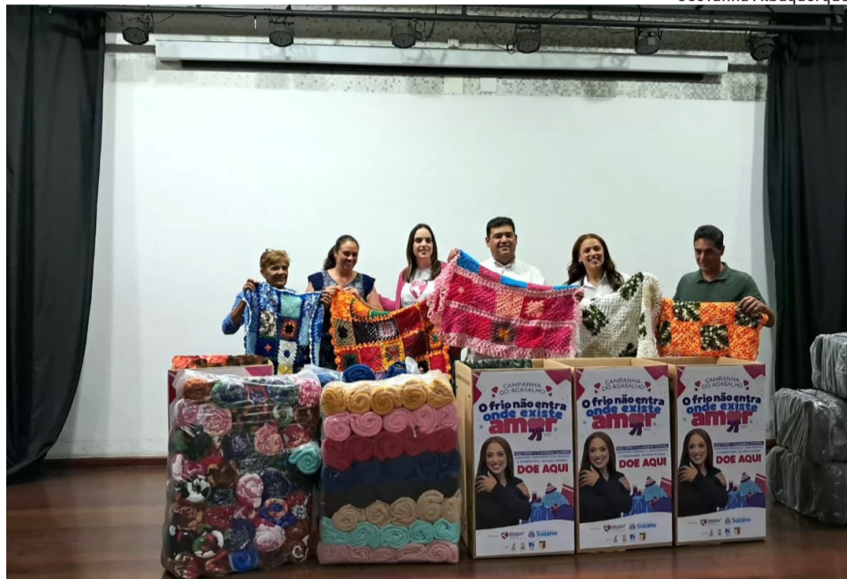
Lançamento ocorreu nesta segunda-feira (27) e já registrou a doação de 250 itens