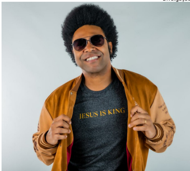
Programação de shows promete reunir milhares de pessoas