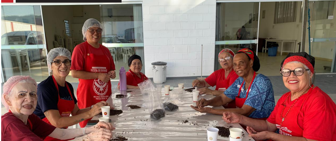
» “Casa da Festa” inicia produção de doces e salgados. Cidades, página 5