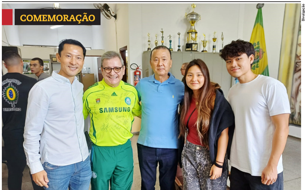
» Legião Mirim de Mogi das Cruzes celebra 50 anos. Cidades, página 8

A Prefeitura de Ferraz de Vasconcelos lançou o edital do programa Vestibular Social 2026, que concederá 50 bolsas de estudo para o ensino superior. Cidades, página 4