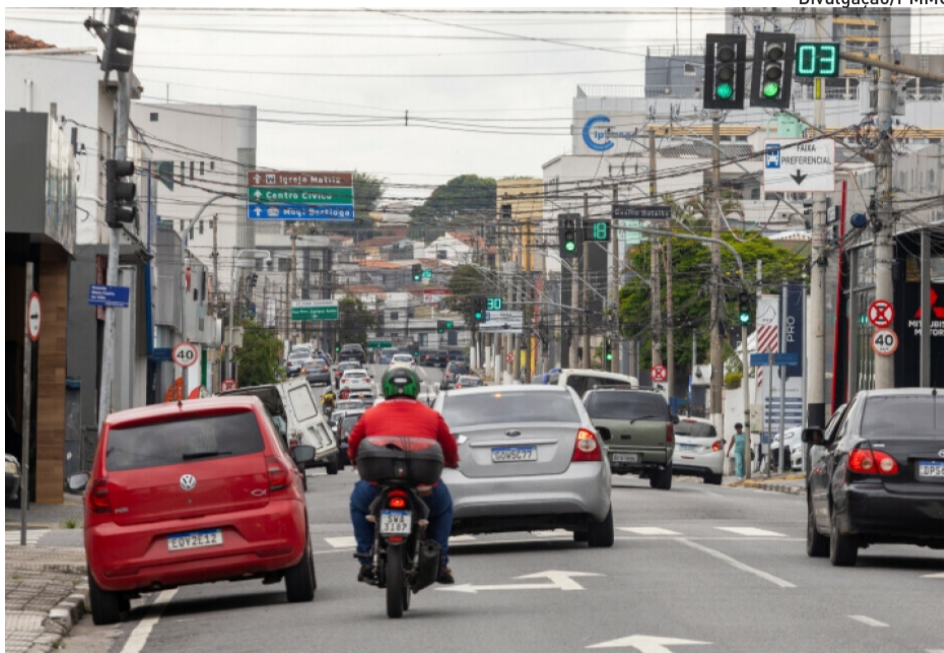
Em Mogi, o número de óbitos em sinistros de trânsito caiu de 21 para 10

Apesar das reduções na escala regional, algumas cidades do Alto Tietê registraram aumento nas mortes