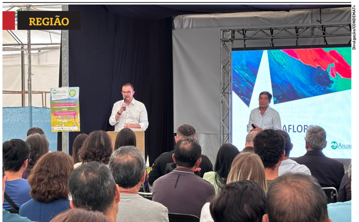
» Parque de Flores e Plantas é lançado em Arujá. Cidades, página 4

A edição do projeto Rua Mais Feliz de hoje (11) será na escola Professora Guiomar Pinheiro Franco, no Jardim São Pedro, em Mogi. Cidades, página 4