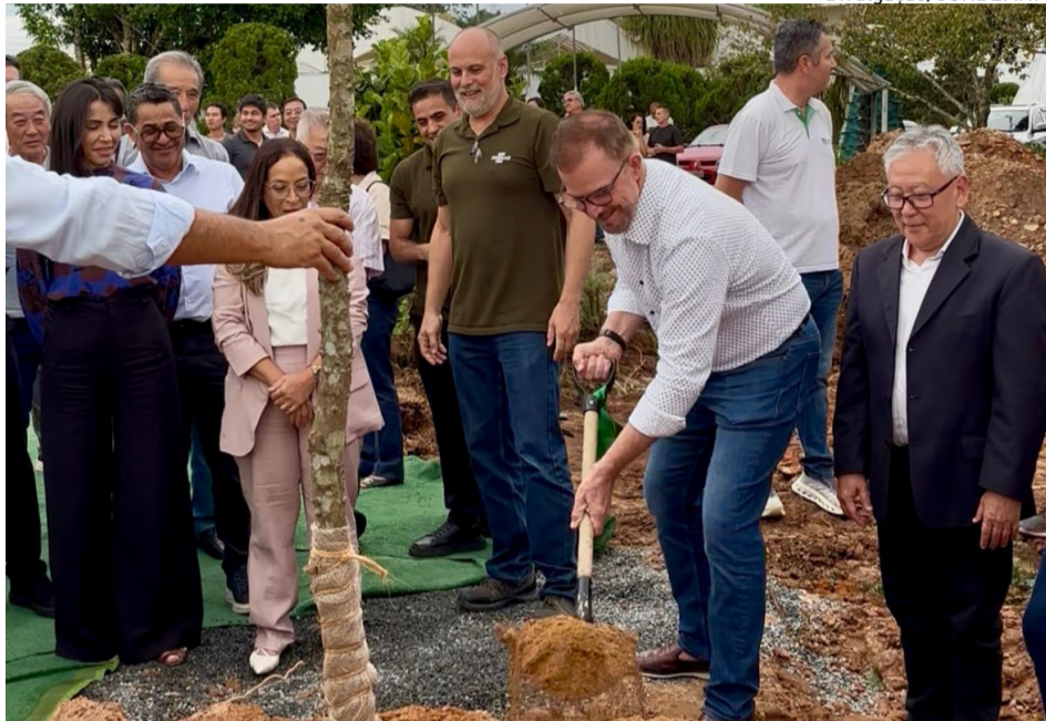
A solenidade na quarta contou com apresentação técnica e um plantio simbólico

O secretário de Cultura e Turismo de Joinville