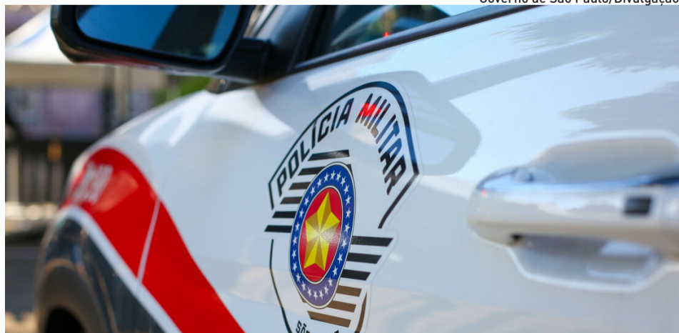
Abordagem foi realizada por equipes da Força Tática em patrulhamento na Vila Natal