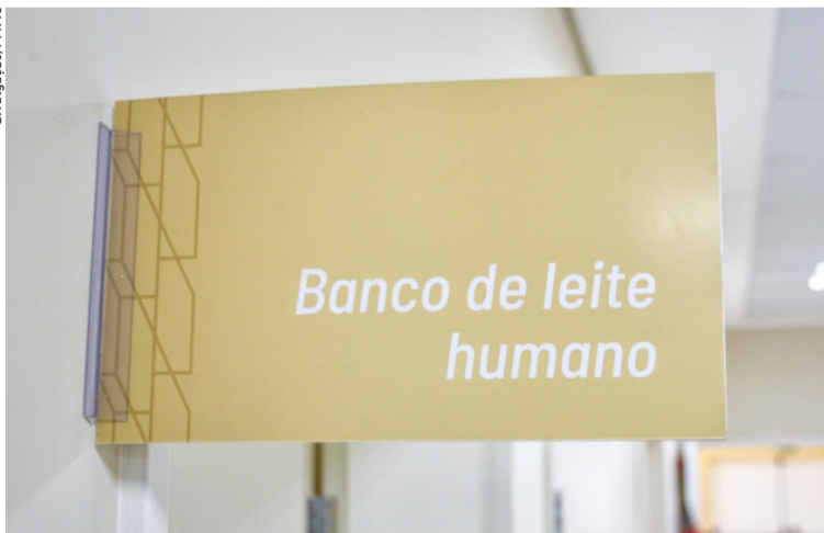
A Prefeitura de Mogi acaba de lançar o atendimento domiciliar do Banco de Leite. Cidades, página 5