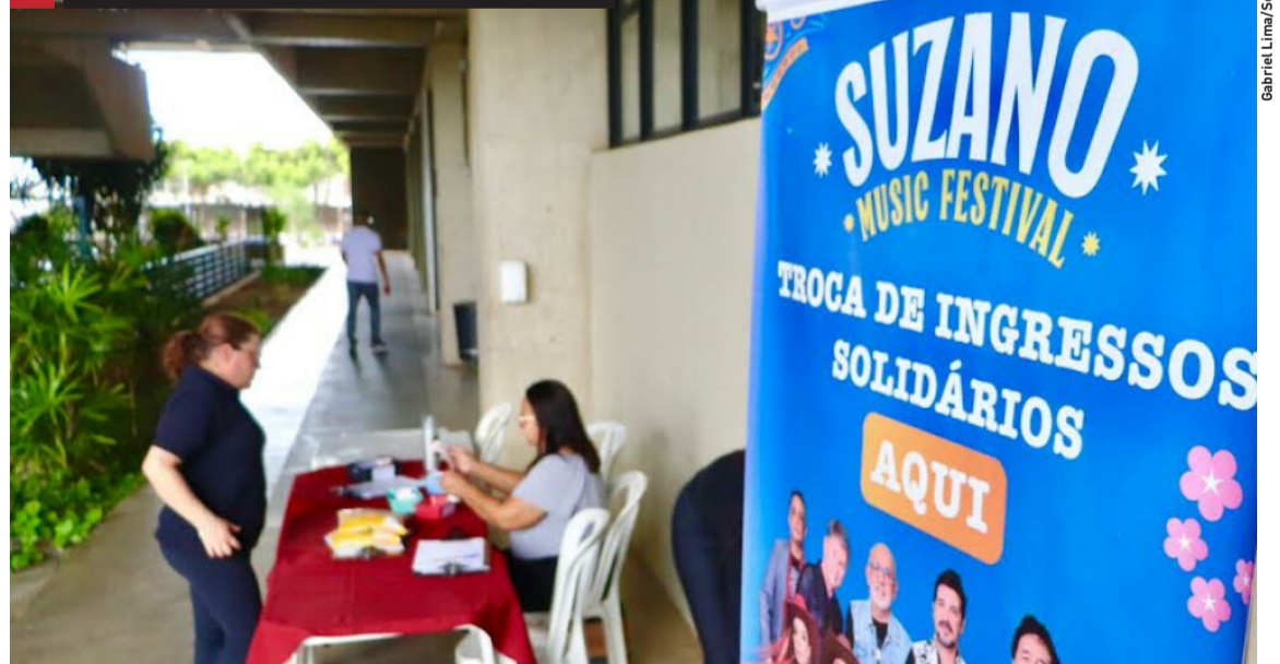
Gabriel Lima/Secop Suzano