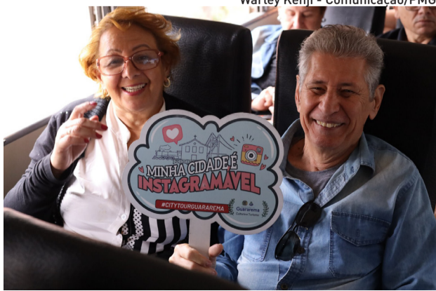
Warley Kenji - Comunicação/PMG

Passeio exclusivo para moradores será no dia 1º de março