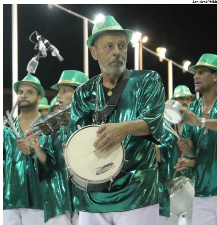
Acadêmicos do São João é uma das escolas mais antigas