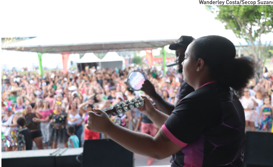
Wanderley Costa/Secop Suzano

O Parque Municipal Max Feffer (Jardim Imperador) permanecerá aberto das 6 às 18 horas, com quadras de futsal e basquete, pistas de