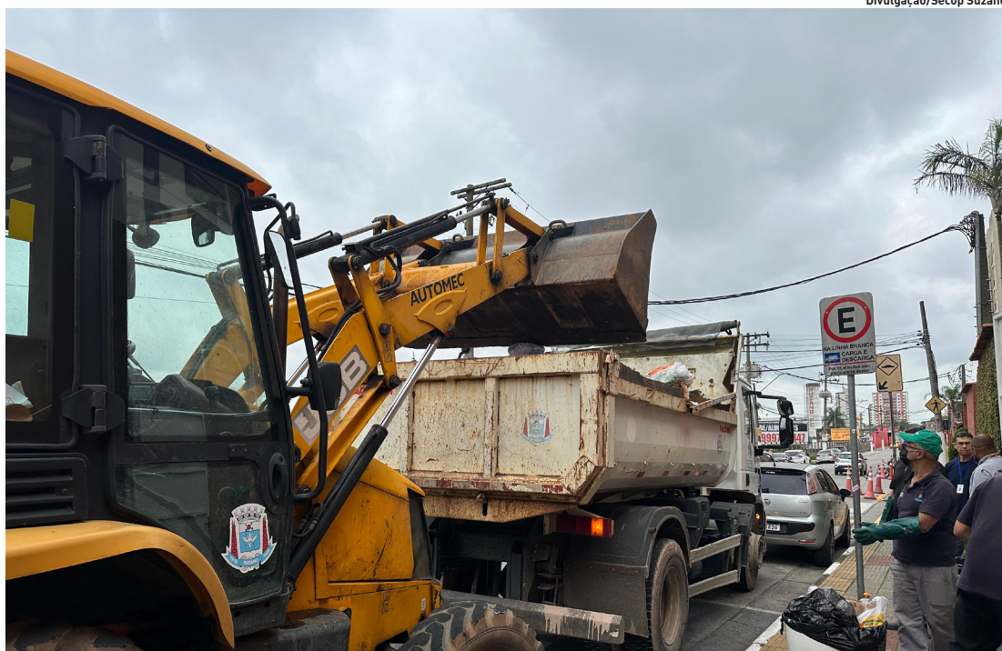
Equipes da Prefeitura foram mobilizadas para garantir a continuidade da coleta de resíduos