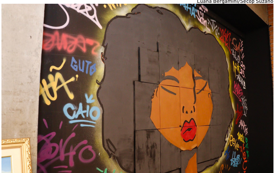
Luana Bergamini/Secop Suzano

No Centro de Educação e Cultura Francisco Carlos Moriconi (rua Benjamin