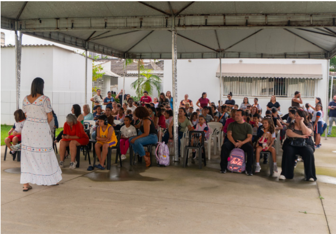
O primeiro dia letivo na rede de Mogi foi dedicado a atividades de acolhimento, com foco na adaptação

Roberto Simonsen Obras em avenida chegam a 90% Cidades, página 3