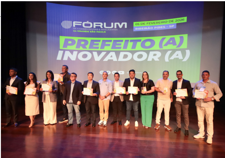
Prefeito Pedro Ishi recebeu o título de “Prefeito Inovador” da Rede Cidade Digital. Cidades, página 4

Cidades Digitais e Inteligentes Prefeito de Suzano é homenageado em Fórum