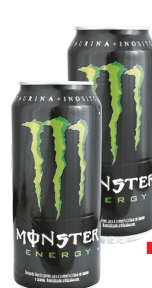
Energético Monster Latão 473ml