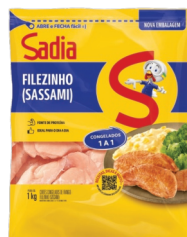
Filezinho de Frango Congelado Sadia Pacote 1kg