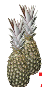
Abacaxi Pérola unid.