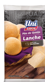
Pão de Queijo Uni Sabor Lanche 2kg