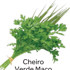
Cheiro Verde Maço