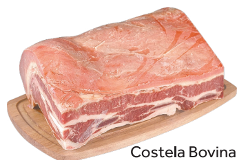
Costela Bovina Minga kg