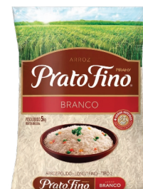
Arroz Prato Fino Tipo 1 Pacote 5kg (Exceto Parboilizado)