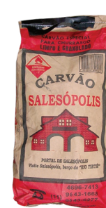
Carvão Vegetal Salesópolis 2kg