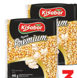
Milho para Pipoca Premium Kisabor Pacote 400g