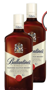
Whisky Ballantine's Finest 750ml