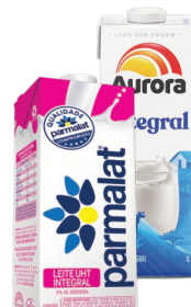
Leite Longa Vida Aurora / Parmalat TP 1 Litro (Exceto Zero Lactose)