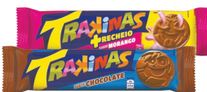
Biscoito Trakinas Recheado 126g