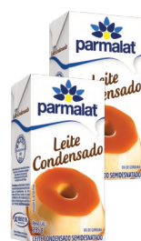
Leite Condensado Parmalat Semidesnatado TP 390g