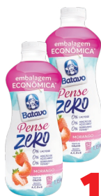
Iogurte Batavo Pense Zero 1,15kg