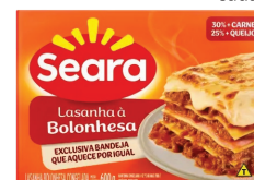
Lasanha Seara 600g