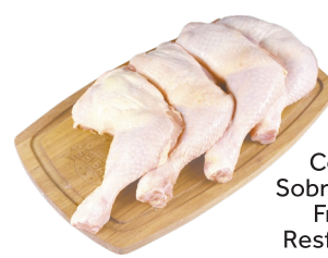
Coxa c/ Sobrecoxa de Frango Resfriada kg