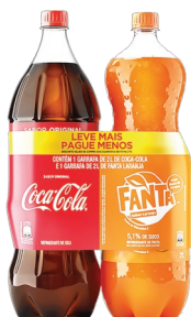
Refrigerante Coca-Cola Pet 2 Litros + Fanta Laranja Pet 2 Litros