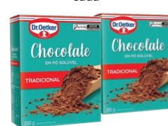
Chocolate Em Pó Dr. Oetker 200g