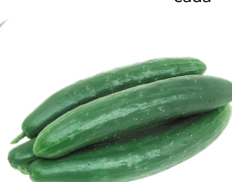
Pepino Japonês kg