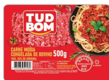
Carne Moida Bovina Congelada Tudbom Pacote 500g