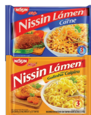
Macarrão Instantâneo Nissin Lâmen 85g (Exceto Turma da Mônica / Chico Bento)