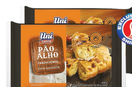
Pão de Alho Uni Sabor Tradicional 400g