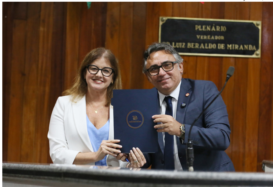
Prefeita fez balanço de ações de 2025 e entregou planejamento para este ano