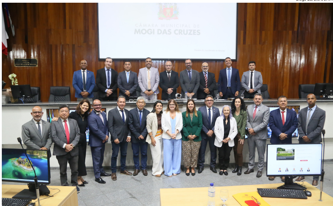
Primeira sessão do ano reuniu vereadores e representantes do Judiciário e Executivo

O Museu de Arte Sacra de São Paulo recebe, neste sábado (7), uma mostra especial da tradição centenária da Festa do Divino Espírito Santo de Mogi das Cruzes. O evento é um convite para quem busca um programa cultural diferente. Cidades, página 5