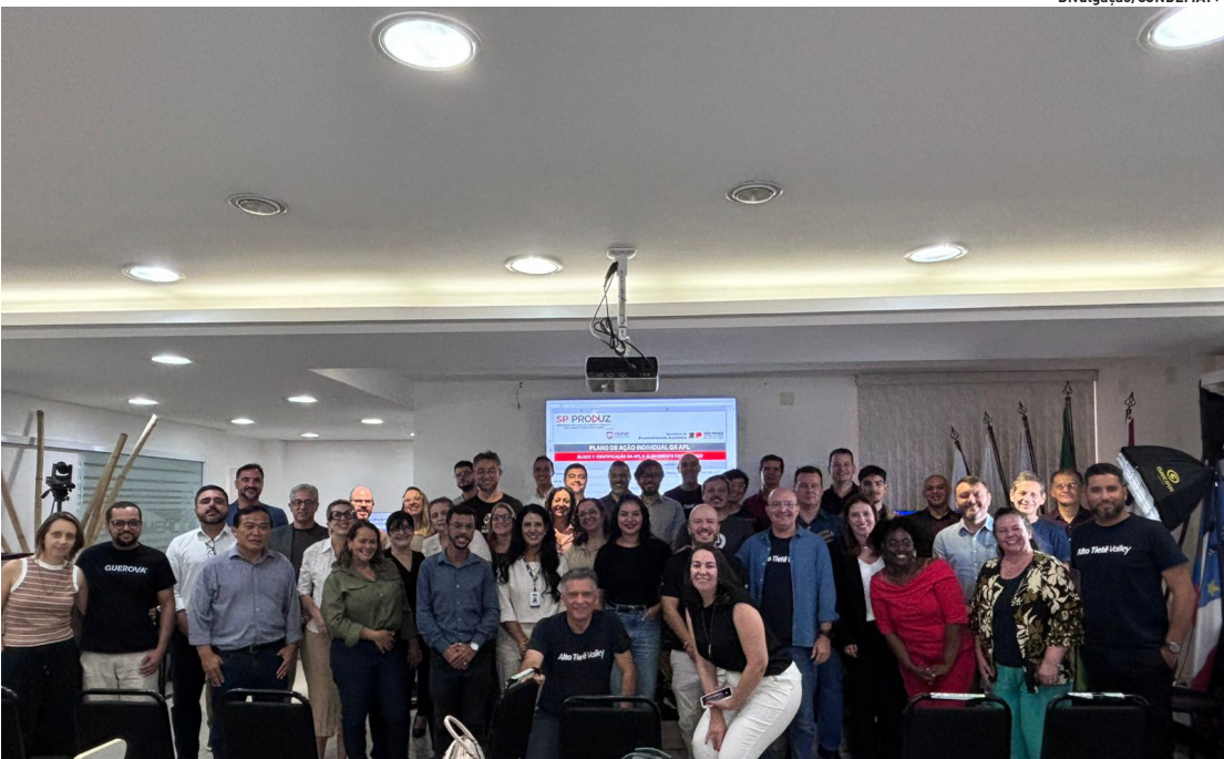
Encontro reforça articulação para reconhecimento no programa SP Produz e ampliação de investimentos