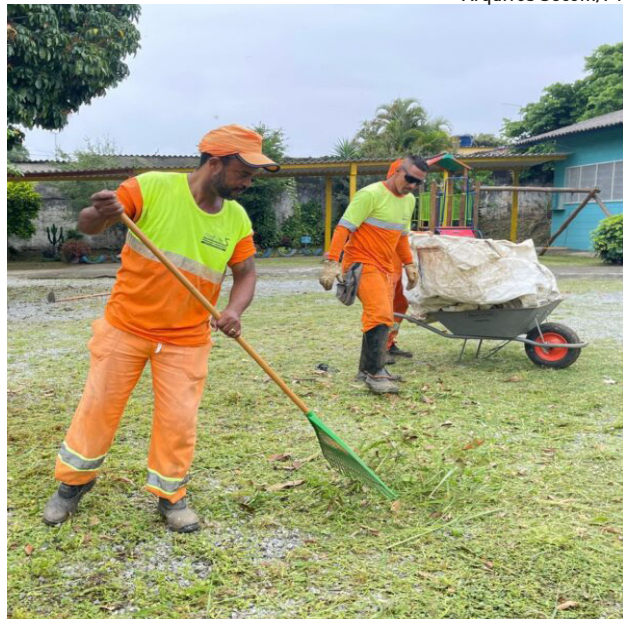
Ações incluem roçagem, capinação, poda de árvores e limpeza