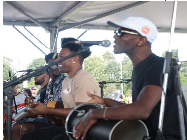
Evento contará com apresentação musical a partir das 13h30