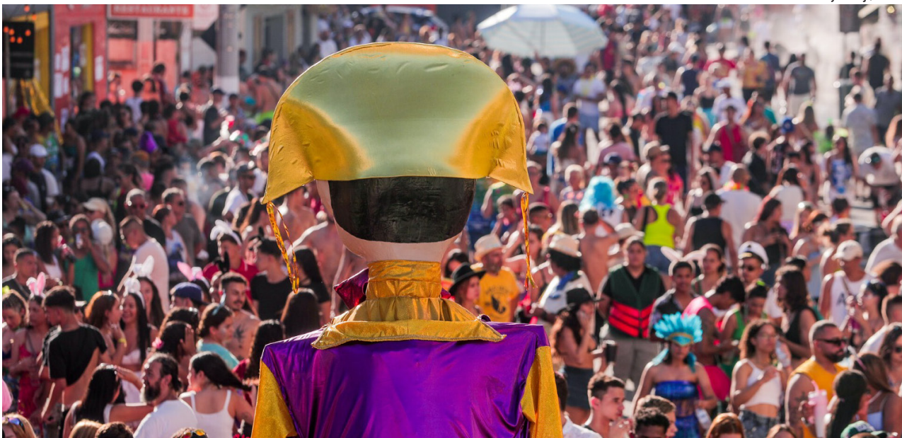
Traidcionais bloquinhos fazem parte da programação da folia, com várias atrações ao logo das festividades

No próximo sábado (14), o Bloco Arueira abre oficialmente o Carnaval, seguido pelo O Lindo Bloco do Amor, que