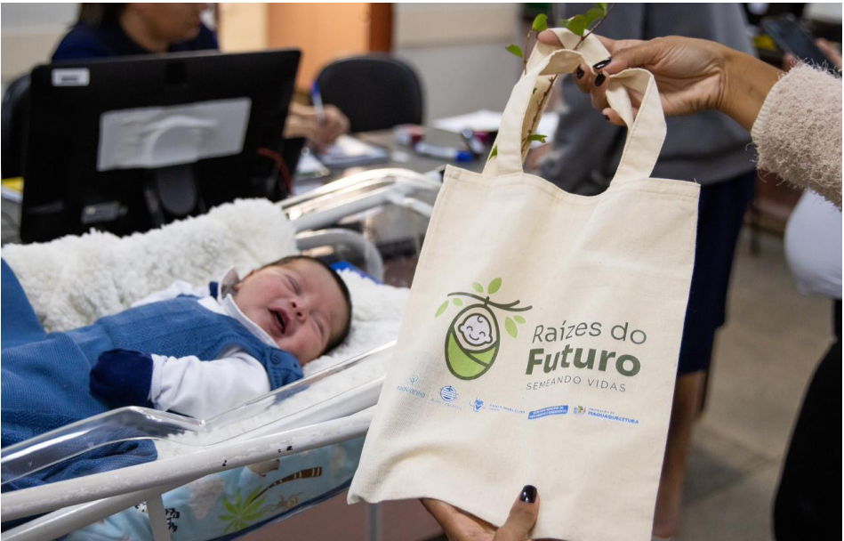
Mudas distribuídas são das espécies pitangueira e cereja-do-rio-grande

“Só de imaginar que temos 200 árvores identificadas com o nome dos recém-nascidos já é motivo de muita alegria. O resultado mostra que estamos no caminho certo. Unir o nascimento de uma criança ao plantio de uma árvore é um gesto simples, mas poderoso, que contribui para formar cidadãos mais conscientes e construir uma