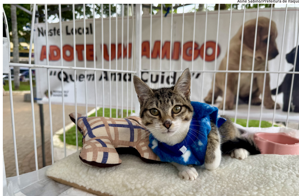
Aline Sabino/Prefeitura de Itaquá

Município também realiza campanhas de adoção responsável e promove outras iniciativas de bem-estar animal