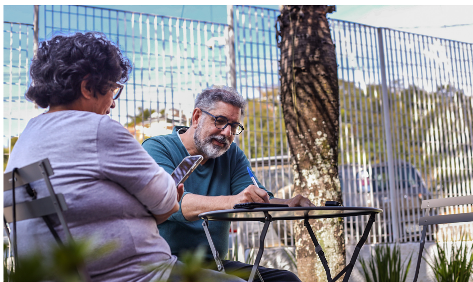
Warley Kenji - Comunicação/PMG

A Prefeitura de Guararema, por meio da Secretaria Municipal de Cultura e Turismo, abre, nesta segunda-feira, dia 2 de fevereiro, as inscrições para oficinas culturais oferecidas na região central e no bairro Parateí. As atividades têm como objetivo incentivar a expressão artística, o aprendizado e a vivência cultural. As matrículas podem ser realizadas de segunda a sexta-feira, das 8 às 17 horas, no Centro Cultural Nelson da Silva Braga, localizado na Praça Coronel Brasília Fonseca, 54, Centro.