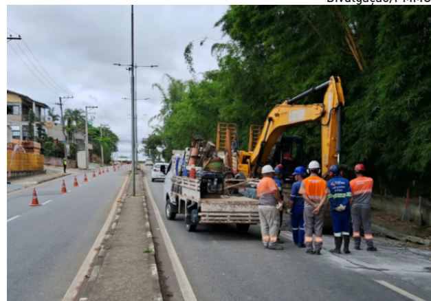
Tubulação antiga foi trocada por uma mais moderna e resistente

Segundo a Prefeitura, a mesma equipe fez durante o final de semana uma operação Tapa-Buraco na rua Barão de Jaceguai, no Centro, que tapou 13 buracos.