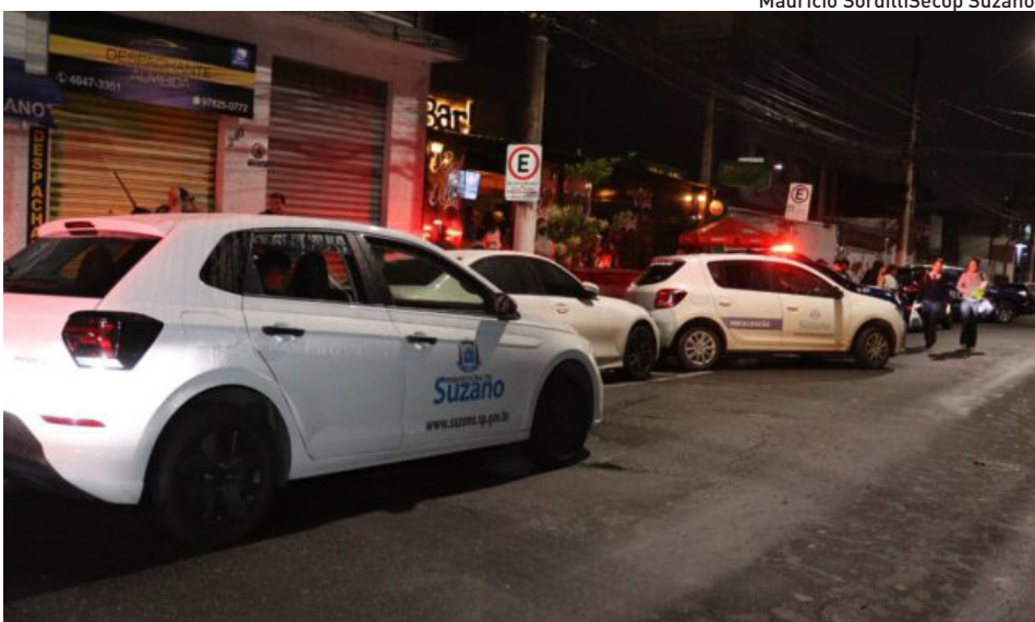
Mauricio Sordilli/Secop Suzano

Já no Jardim Nazareth, um bar na rua General José Galetti foi autuado pela Vigilância Sanitária por descumprimento da Lei 12.546, de 14 de dezembro de 2011 (a Lei Antifumo), e notificado pelo Setor de Fiscalização de Posturas por exceder o horário de funcionamento, obstruir a calçada e faltar com a documentação, resultando na paralisação das atividades. No Jardim Imperador, uma