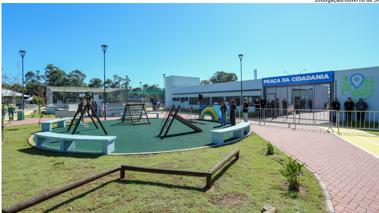
Praça de Mogi está localizada na avenida Lourenço de Souza Franco, número 1.030, em Jundiapéba