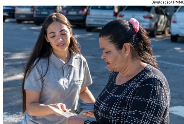
Educadores vão dar orientações para pais de alunos

No dia 10, vias de duas outras escolas receberão os educadores: às 7h, na avenida Kaoru Hiramatsu, 202, no Oropó; às 11h30, na rua Sérgio Plaza, 558,