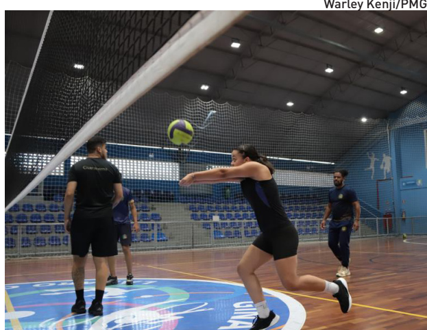
Atividades acontecem no Ginásio Municipal Lázaro Germano

Nesta segunda-feira (26) e terça-feira (27), a agenda foi programada com voleibol