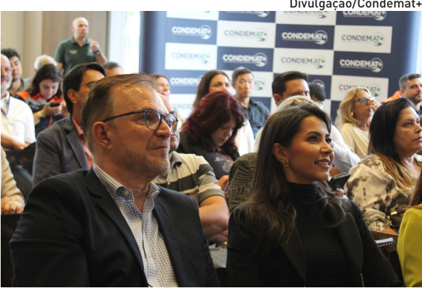
Presidente do Consórcio anunciou novidades

Também foi anunciado o novo Grupo de Trabalho de