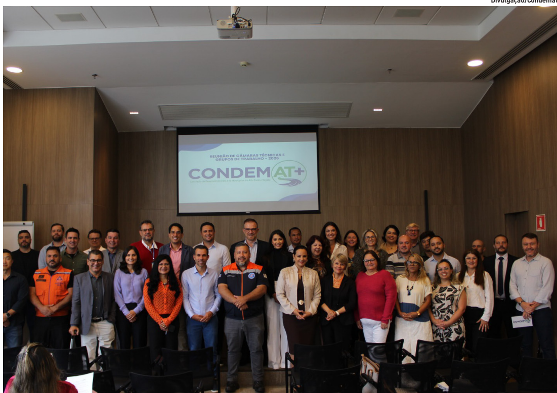
Consórcio regional contará neste ano com 13 Câmaras Técnicas e 12 Grupos de Trabalho