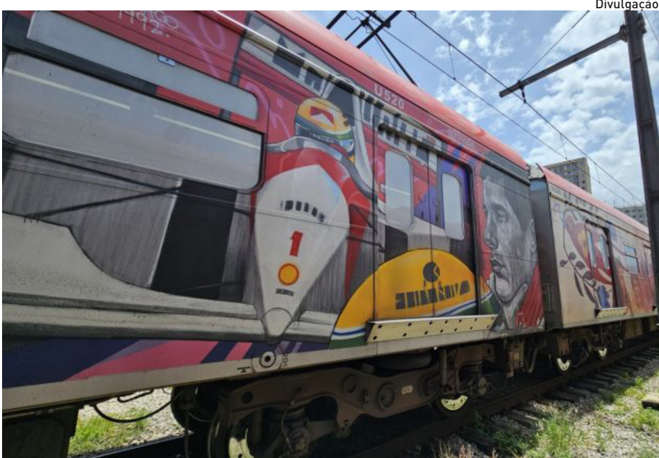
A ação homenageia o paulistano Ayrton Senna, um dos maiores ídolos do esporte

Oito artistas urbanos foram contratados por meio de um termo de cooperação entre a CPTM e a Secretaria