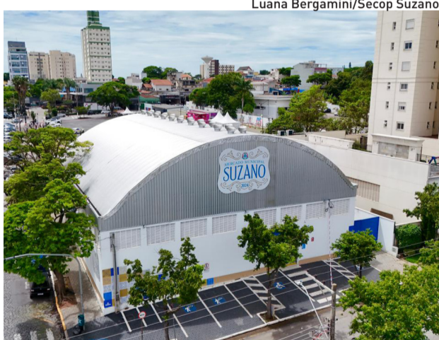
Luana Bergamini/Secop Suzano

No local, o público encontra uma ampla variedade de produtos que vão desde hortifruti frescos até massas artesanais, queijos, vinhos, cafés, cervejas artesanais, temperos, doces caseiros e itens de mercearia fina. O espaço também conta com boxes especializados em carnes e em diferentes gastronomias, como a japonesa, mexicana, portuguesa, mediterrânea e baiana, além de produtos típicos das culinárias mineira e nordestina. Há ainda boxes dedicados ao artesanato local, atendendo