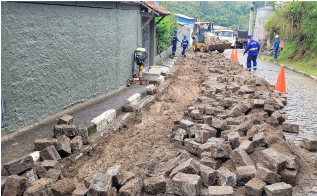
Além das redes de esgoto, o projeto do Semaes inclui a construção de três estações elevatórias

As dez cidades do Alto Tietê encerraram 2025 com 2.537 casos confirmados de dengue. Os dados foram levantados pelo Grupo Mogi News a partir do Painel de Arboviroses da Secretaria de Estado da Saúde de São Paulo. Não houve registro de mortes, mas um óbito em Mogi das Cruzes estava em investigação. No período, foram 11.549 casos descartados. Conforme a última atualização da plataforma, nos 18 dias de janeiro foram registrados 11 casos confirmados. Cidades, página 4