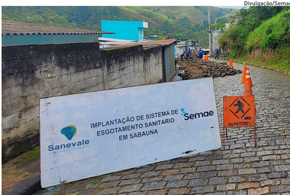
Além das redes, o projeto inclui a construção de três estações elevatórias

Atualmente, além da Vila Mathias, o Semae e a Prefeitura também investem na implementação de um sistema de esgotamento sanitário no Jardim Nove de Julho, em Jundiapéba.