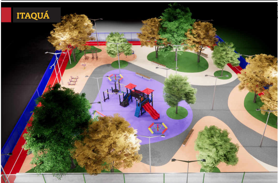
» Obra vai levar esporte e lazer ao Jardim Maragogipe. Cidades, página 5