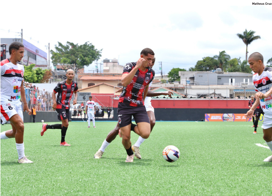
Itaquá Athletico Clube recebe o Novorizontino (SP) nesta quarta-feira (7) no Campo do Brasil

Mogi das Cruzes e Itaquaquecetuba recebem nesta quarta (7), jogos da segunda rodada da Copa São Paulo. No mesmo horário, às 13 horas, em busca da segunda vitória, o União Mogi enfrenta o Centro Olímpico, e o Itaquá Athletico Clube joga com o Novorizontino. Cidades, página 4