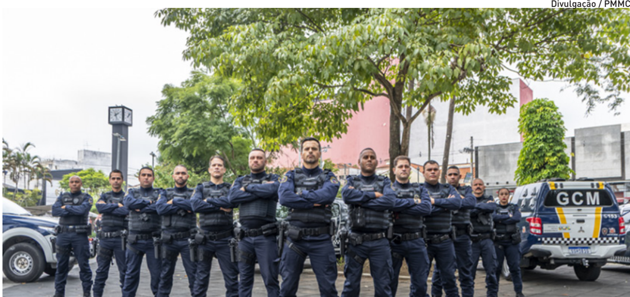
Com destaque para latrocínio e homicídio por acidente de trânsito, que caíram 100% e 68%, respectivamente

“Estamos no quinto mês seguido de queda nos índices criminais e, desta vez, com uma redução de todo o período, entre janeiro e novembro. Isso é resultado do investimento em segurança que a Prefeitura vem fazendo desde janeiro de 2025, com o Smart Mogi, maior número de guardas civis municipais, capacitação, entre outros recursos que estão fazendo