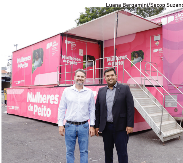
O prefeito e o secretário visitaram a estrutura

As imagens do exame são disponibilizadas à paciente no próprio dia, enquanto o laudo médico pode ser acessado em até 48 horas por meio de uma plataforma on-line. No momento do atendimento, cada mulher recebe um protocolo com login e senha para consulta do resultado, o que contribui para a agilidade no