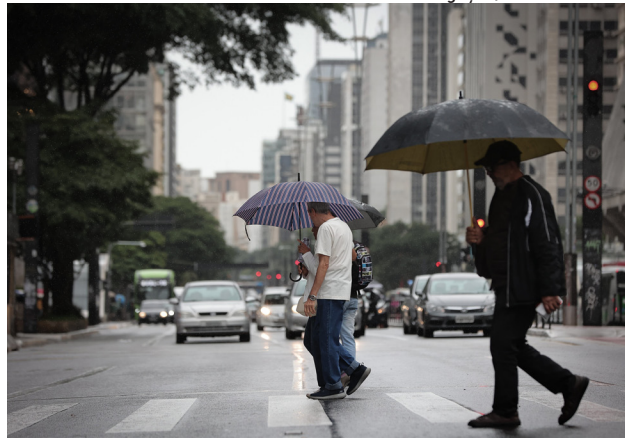
Previsão é de tardes quentes, com possibilidade de chuvas