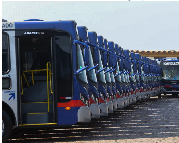
Reajustes dos ônibus variam de acordo com cada linha