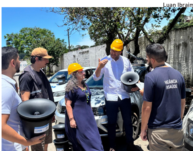
Iniciativa envolve diversas secretarias do município

As armadilhas inteligentes adotadas por Poá são desenvolvidas em plástico resistente e baseadas em um mecanismo simples e eficaz, que combina água limpa e uma isca de odor para atrair as fêmeas em busca de locais para depositar seus ovos. Ao entrar no dispositivo, o mosquito tem contato com larvicida e um fungo específico para a espécie, que, além de provocar sua morte de forma gradual, permite que ele saia da armadilha carregando o inseticida nas patas. Com isso, o mosquito contamina outros criadouros próximos, inclusive pontos de difícil acesso, como ralos, calhas e recipientes escondidos, ampliando o alcance e a eficiência da tecnologia.