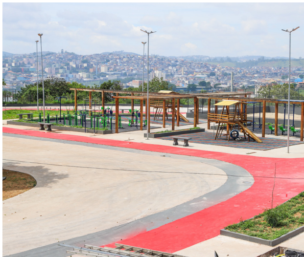
O local terá novos equipamentos como pista de caminhada