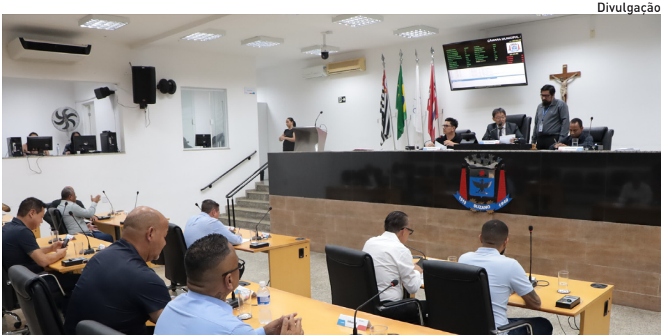
Os vereadores ainda votaram favoravelmente a outros 15 itens na quarta-feira