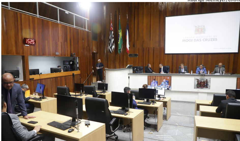
Foram apresentadas oito emendas parlamentares ao projeto da LDO 2026

O projeto também autoriza a abertura de créditos adicionais suplementares e especiais de até 12% do total da despesa prevista no orçamento de 2026, para