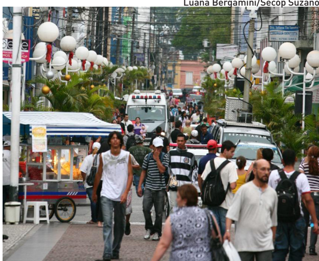
Luana Bergamini/Secop Suzano

Em Suzano, de acordo com a ACE, a projeção é de