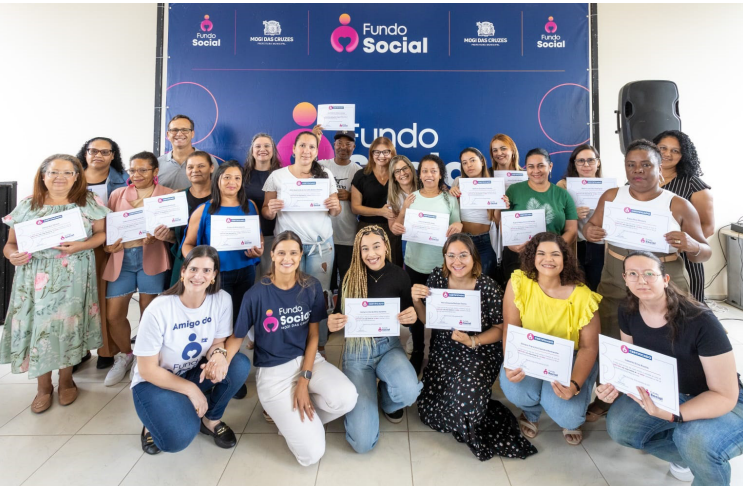
Cerimônia nesta terça-feira (9) foi para a quarta turma de cursos da Vila Brasileira. Cidades, página 4

SEGURANÇA DDM de Mogi está em novo prédio. p8