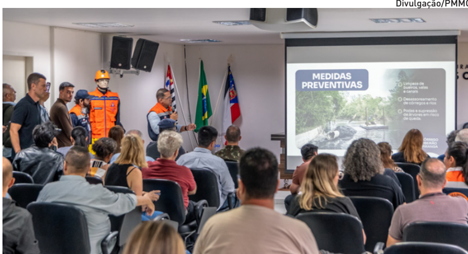
Equipe apresentou as ações realizadas e pediu apoio contra o descarte irregular

Entre as ações preparatórias, Almeida destacou o mapeamento e monitoramento de áreas de risco, reuniões temáticas com secretarias e com o Gabinete, definição de atribuições e responsabilidades, campanha de conscientização e preparo operacional — incluindo novos equipamentos de proteção individual. O plano