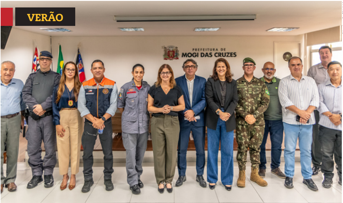
» Mogi inicia operação com força-tarefa até março. Cidades, página 5