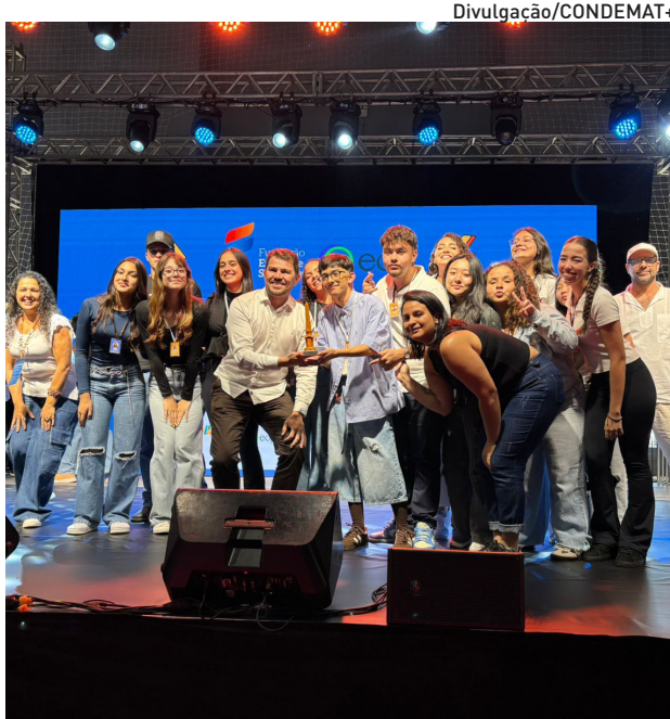
Evento final reuniu a apresentação de 15 projetos