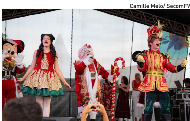
Ferraz deu início a programação natalina no sábado

O Trenzinho da Alegria também funciona até o dia 23, com operações aos finais de semana, das 18h às 21h. A partida ocorre na Praça da Independência, com destino ao Castelo do Papai Noel.