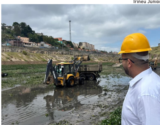
Chefe do Executivo, que esteve no piscinão na quinta

O prefeito destacou ainda a importância de planejar e agir antes que os problemas se tornem inevitáveis. “O período