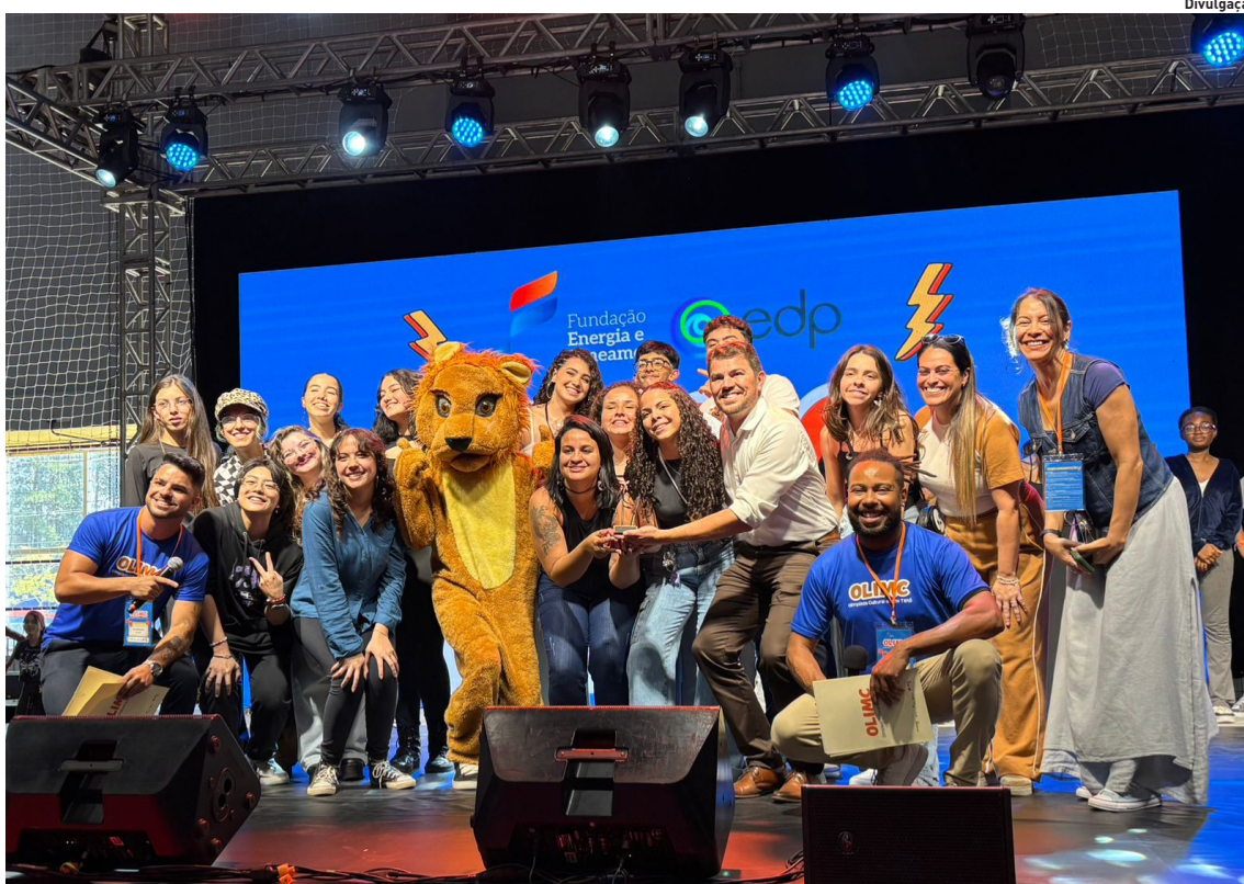
O destaque ficou para a Escola Estadual Vereador Elisiário Pinto de Moraes, de Salesópolis

Ciesp Alto Tietê apresenta nova diretoria para 2026. p3