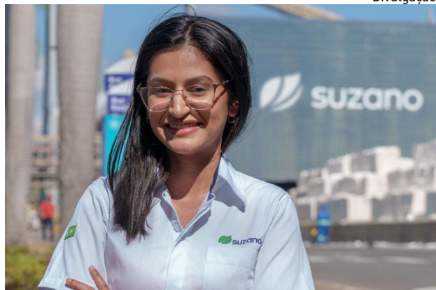
Inscrições podem ser feitas até a próxima segunda-feira