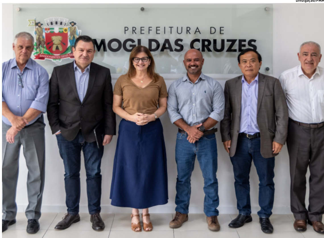
Prefeitura se comprometeu a criar condições para a capacitação das funções mais técnicas

NATAL SEGURO Suzano alinha estratégias para iniciar operação. p3