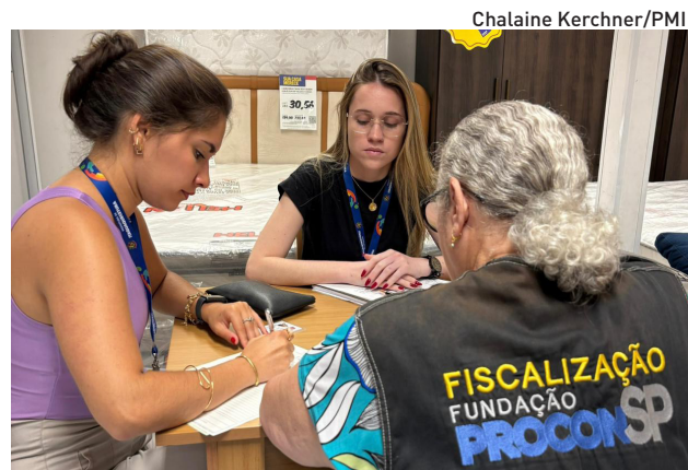
Equipes concentraram as primeiras visitas na região central

As equipes concentraram as primeiras visitas na região central, com atenção especial aos estabelecimentos que vendem eletrodomésticos e eletrônicos, setores que tradicionalmente registram maior procura no período. Durante a fiscalização, os agentes verificaram a clareza das informações ao consumidor, a correção dos preços, a veracidade de eventuais promoções e o cumprimento das normas estabelecidas pelo Código de Defesa do Consumidor.