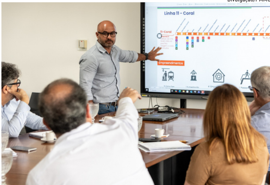
Prefeitura deve criar condições para a capacitação das funções mais técnicas

Somente na Linha 11, que corta Mogi das Cruzes de oeste a leste, estão