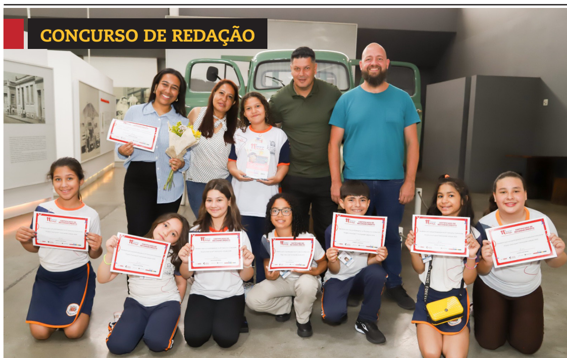
» Instituto Julio Simões premia alunos e professores. Cidades, página 8

A primeira semana do Festival Encantado de Guararema começa hoje (4), reúne dois espaços gastronômicos com decoração natalina e música ao vivo. Cidades, página 4