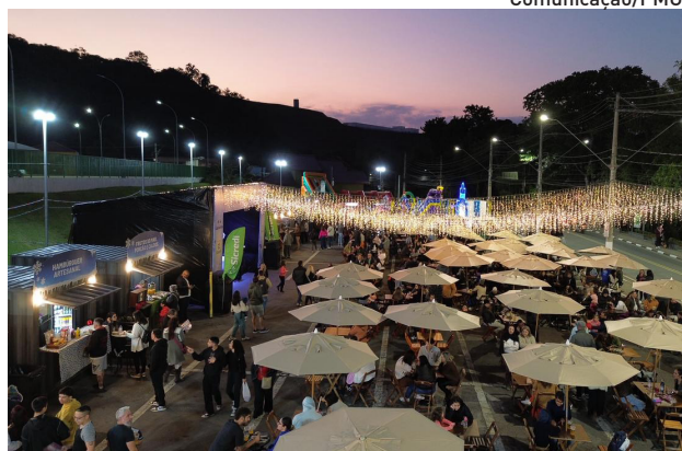
Recanto do Américo é um dos pontos que recebe o festival

As apresentações integram a programação musical do Festival Encantado, que seguirá ao longo de dezembro.