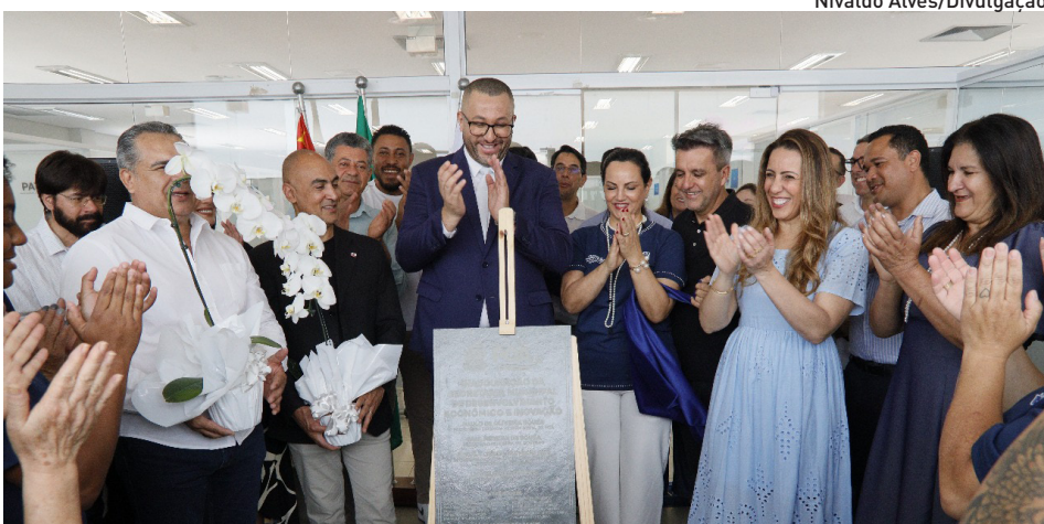
Nova sede consolida estratégia da Prefeitura para fortalecer a economia de Poá